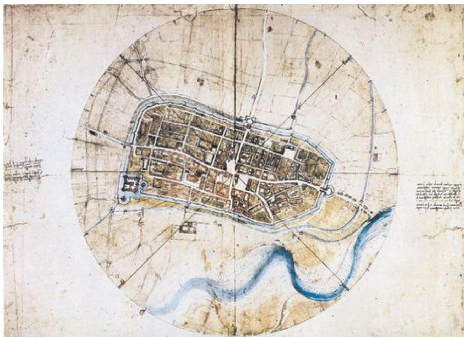
Slika 1. Plan grada Imole, Leonardo da Vinci, oko 1502.

Leonardo da Vinci izradio je i druge karte: nasipi kraj Firence, južna obala Rima (povezano s radovima za Vatikan i njegovim planovima za isušivanje močvarnog tla), kartu doline Chiana u Toskani, kartu svijeta, kartu močvare Pontino i zapadne Toskane, topografsku kartu doline rijeke Arno te projekt kanala prema Sredozemnomu moru.