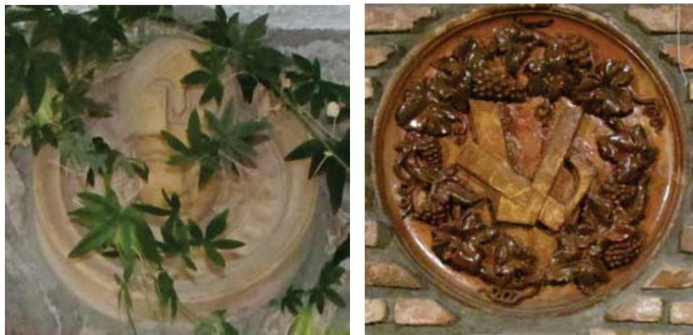
Slika 4. Fasadni dekorativni element s likom božice Minerve (lijevo) i medaljon s inicijalima VL (desno). Obiteljska kuća Gržin, Kraj. Snimio Robert Doričić, 2015.

Unatoč oprečnim stajalištima o vrijednosti toga umjetnikova djela 51 , znatizeljnih posjetitelja koji su dolazili u Kraj, kako čitamo u onodobnim tiskovinama, ali i kasnijim izvješćima, nije nedostajalo. 52 Svima njima slikar bi dugim štapom pokazivao najvažnije ličnosti koje su prema umjetnikovim kriterijima zavrijedile biti na njoj. Slika je jednako intrigirala opatijske i lovranske turiste aristokratskog porijekla kao i intelektualce, umjetnike i sve druge posjetitelje mjesta Kraj. O brojnosti posjeta svjedoči i sljedeći zapis u Seisovu vodiču: „Interesantan je i umjetnikov album ukrašen brojnim potpisima uglednih ličnosti.“ 53