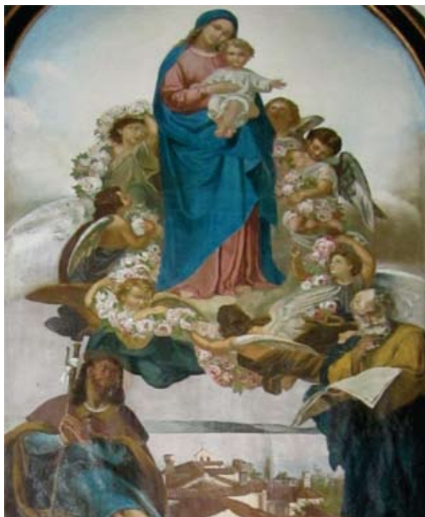
Slika 2. Oltar sv. Josipa. crkva Majke Božje u Kraju, snimila Biserka Doričić, 2010.

godine oslikao strop i gornja polja svetišta. 38 U veprinačkoj župnoj crkvi na bočnom oltaru u desnoj bočnoj lađi crkve nalazila se Lucasova slika s prikazom Svete Obitelji. 39