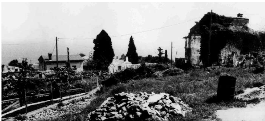
Slika 6. Ostaci ateljea Valentina Lucasa vidljivi na bočnome zidu kuće (na slici desno) i pogled na dio naselja Kraj ispod županijske ceste Rijeka – Pula. Fototeka Konzervatorskoga odjela u Rijeci, snimio V. Malinarić, 1985.

O daljnjoj sudbini derutne Vile Minerve saznajemo iz Carevih autobiografskih zapisa. 70 Nakon uništenja slike u poratnim je godinama s ruševne zgrade skinuta i prodana opeka. Od zgrade su ostali sačuvani tek fragmenti bogate dekorativne fasadne plastike, tragovi u dvorištu kuće budućih vlasnika imanja kao i oni na bočnome zidu starinske kuće na koju je neobična zgrada bila dograđena. Ostaci ateljea na bočnom zidu starinske kuće bili su vidljivi sve do njezine rekonstrukcije početkom devedesetih godina 20. stoljeća.