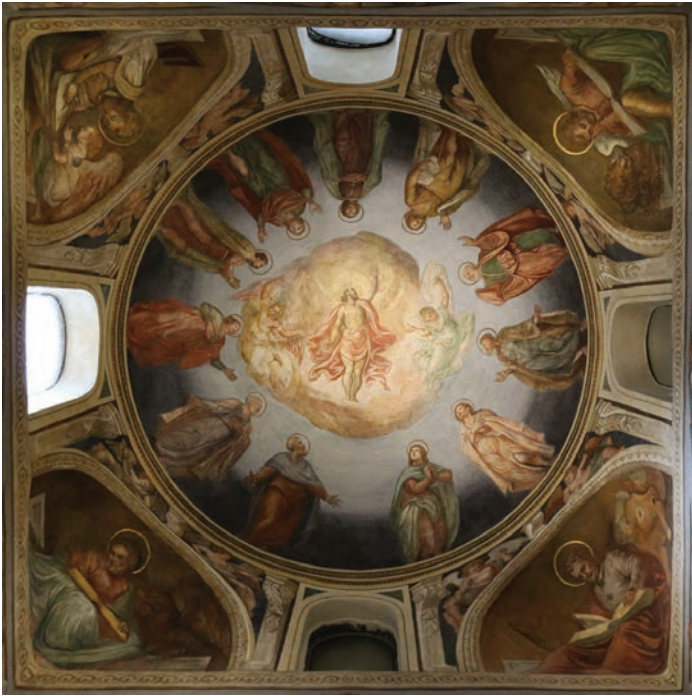
Fig. 6 Padova, Chiesa di Santa Giustina, sacello di San Prodocimo, cupola, Camillo e Tommaso Pellegrino di Chioggia, Cornelio Campagnola, affresco, Ascensione.