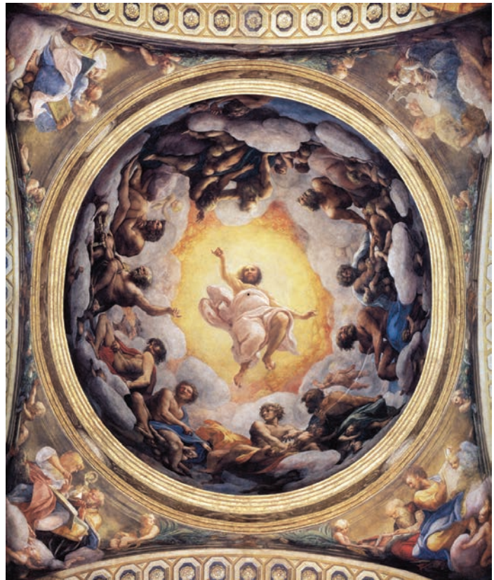
Fig. 12 Parma, Chiesa di San Giovanni, cupola, Correggio, affresco, Visione di San Giovanni.

Proprio la cupola costituisce la chiave di volta di questo processo di risemantizzazione dello spazio martiriale. Infatti, contrariamente a quanto scrisse Leone Micheletto nel 1980 20 , gli affreschi dei fratelli Pellegrini di Chioggia