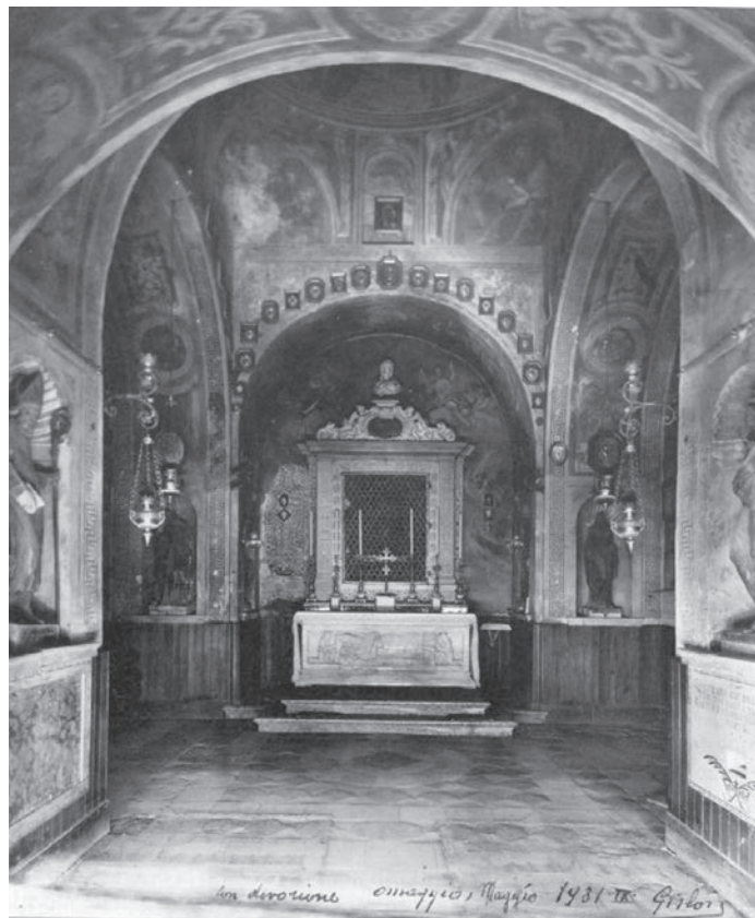
Fig. 10 Padova, Chiesa di Santa Giustina, sacello di San Prosdocimo, foto, veduta meridionale (1931).

Ma non è solo questa la parte interessata dal restauro portato a compimento nel 1564 dall'abate Angelo Faggi. Il cantiere riguarda tutto il versante meridionale della basilica di Santa Giustina, area da un lato aperta sul transetto meridionale della chiesa e dall'altra sviluppata in direzione del monastero. Egli desidera collegare alla grande fabbrica cinquecentesca gli spazi culturali più antichi, costituiti dal sacello e dal pozzo dei martiri, che si apre sul cimitero dove furono rinvenute le sepolture di santa Giustina, martire delle persecuzioni di Massimiano, del proto-vescovo Prosdocimo, dell'apostolo Mattia e dell'evangelista Luca. Infatti il pozzo viene rivestito da marmi lavorati a niello nel 1565, il corri-