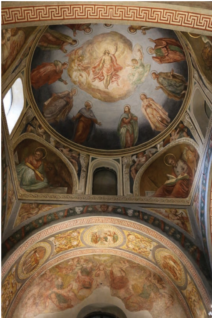
Fig. 11 Padova, Chiesa di Santa Giustina, sacello di San Prosdocimo, affreschi, veduta della lunetta meridionale e della cupola.

l'abate Angelo Faggi valorizza il culto del proto-vescovo della città, il cui sarcofago è rivolto verso la grande basilica benedettina, cui era collegato mediante il corridoio dei martiri. La programmatica celebrazione delle antichità apostoliche della città, veniva ribadita dalla pergula , collocata lungo il corridoio, di fronte al sarcofago. L'iscrizione sorretta dalle colonnine invoca l'intercessione dei santi apostoli e dei molti martiri le cui reliquie sono posate in hoc loco , affinché si degnino di pregare per il committente e per tutti i fedeli 19 (fig. 5). Questo ricollocamento della pergula è del tutto congruente con il nuovo allestimento: l'altare del santo confessore, proto-vescovo della città, si trova in questo modo in posizione frontale rispetto alla pergula , che invoca gli apostoli e i martiri, ponendo Prosdocimo in asse con una tradizione apostolica che culmina nella cupola.