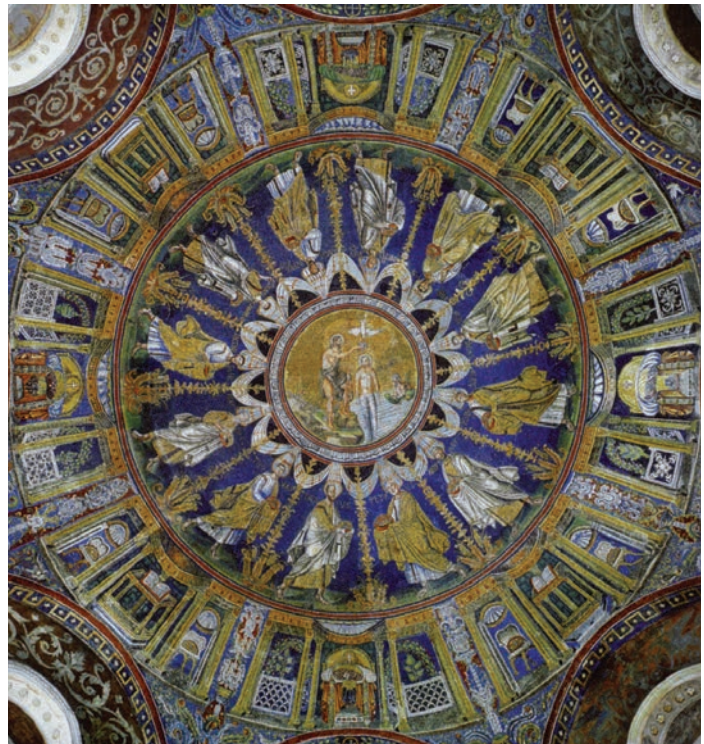
Fig. 9 Ravenna, Battistero Neoniano, cupola, mosaico, Battesimo di Cristo e Collegio apostolico.