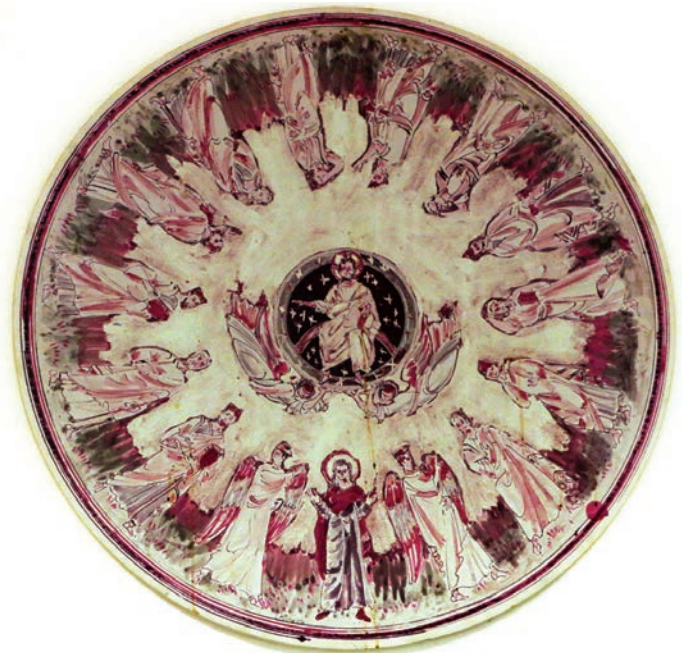
Fig. 7 Padova, Abbazia di Santa Giustina, Istituto di liturgia pastorale, Leone Micheletto, ricostruzione del perduto mosaico della cupola del sacello di San Prodocimo, riproduzione dell'acquerello originale.