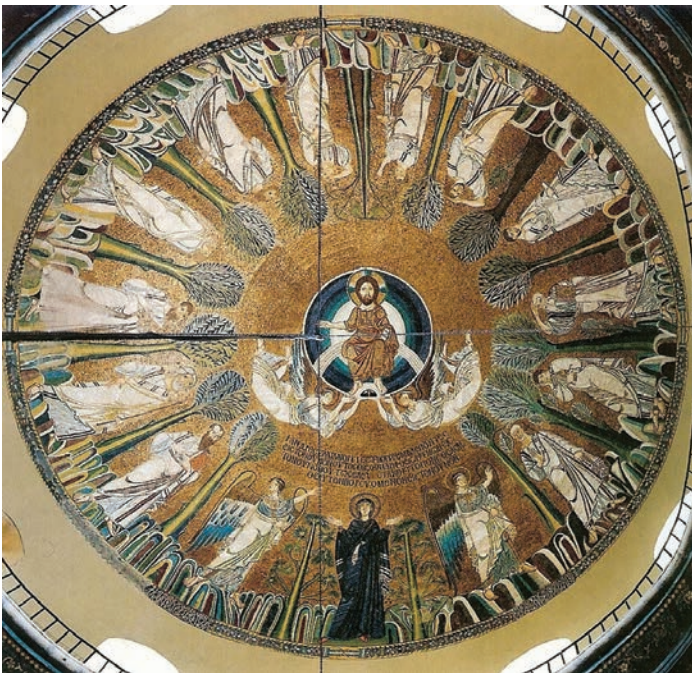
Fig. 8 Thessaloniki, Santa Sofia, cupola, mosaico, Ascensione.

che “troverebbe le sue ascendenze” in quella di San Giorgio a Salonicco, giusto perché la Leggenda di San Daniele , fonte medievale trādita da una raccolta erudita ottocentesca sulla storia della chiesa patavina, asserisce che la volta del sacello era opere musoleo depicta quasi celeste palatium 13 .