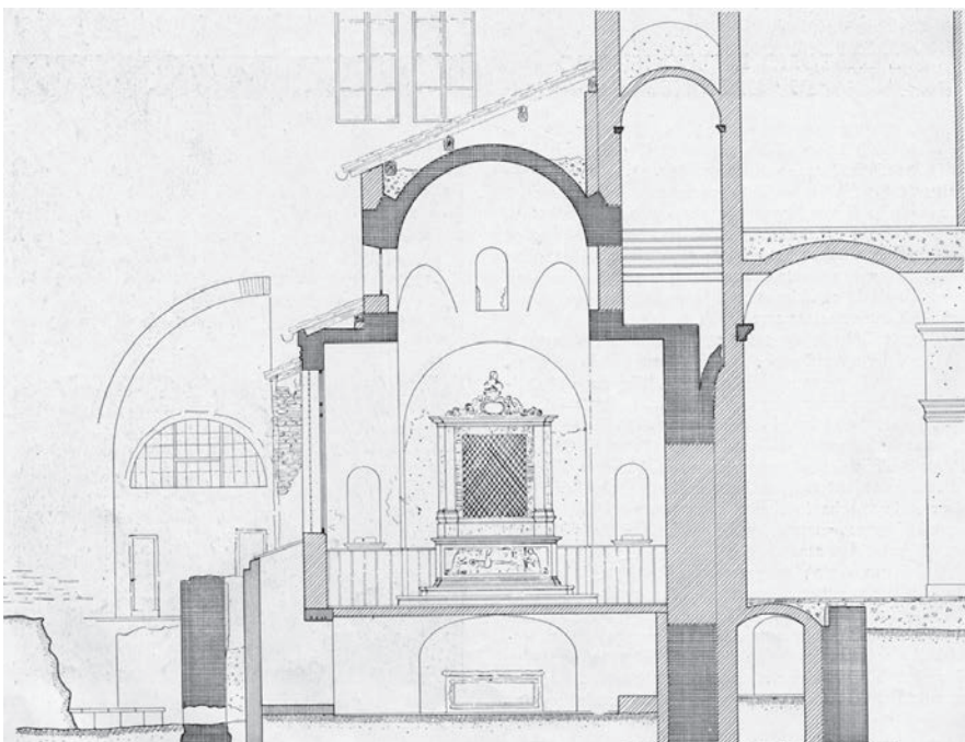
Fig. 3 Padova, Chiesa di Santa Giustina, sacello di San Prosdocimo, sezione sud (da Micheletto 1954).

volte del cimitero ipogeo con delle solide travi in cemento armato. Venne quindi posato il polito rivestimento a lastre marmoree, venne riaperta una finestra tamponata sul lato meridionale del sacello, fu ricostruita l'abside nel suo profilo