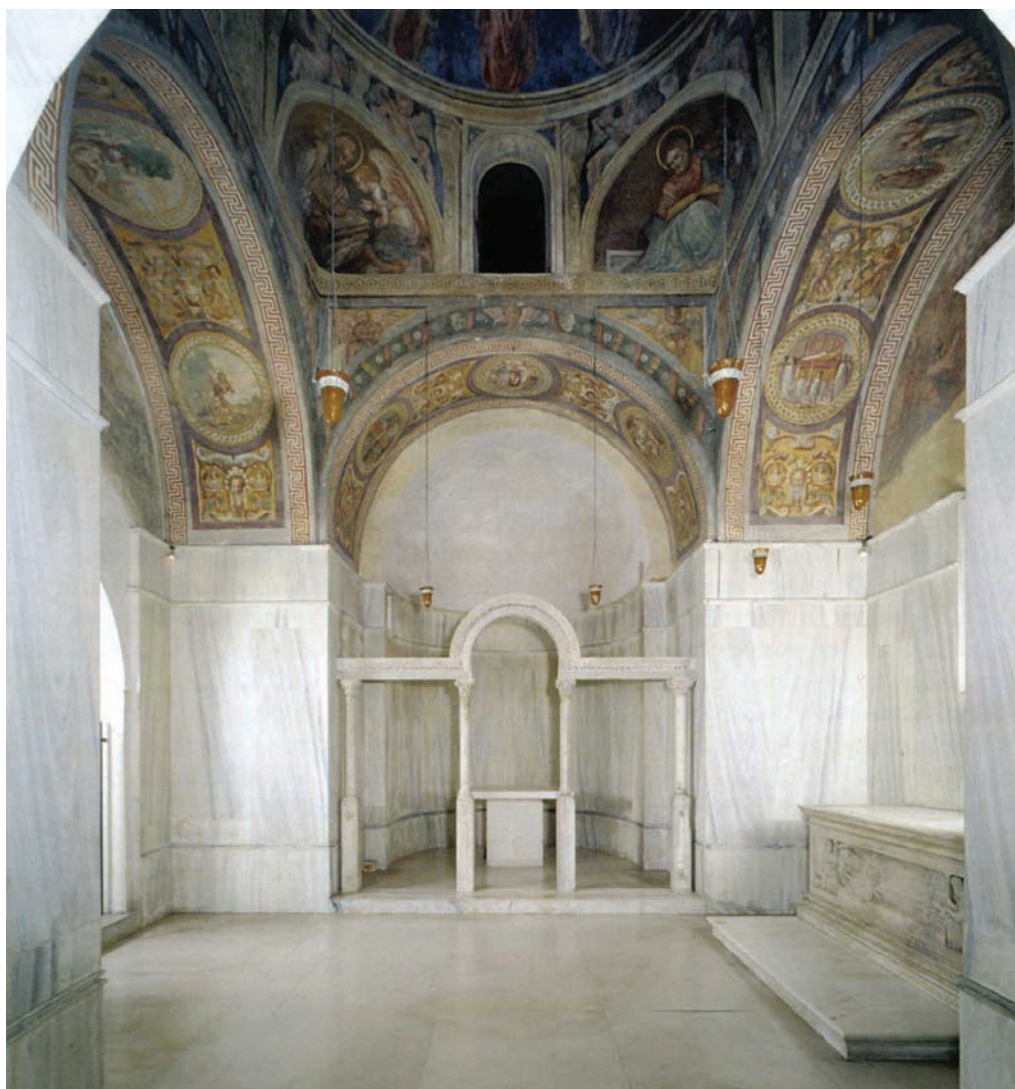
Fig. 1 Padova, Chiesa di Santa Giustina, sacello di San Prosdocimo, veduta absidale.

Fortunato di Vicenza, realizzata su committenza di un altro funzionario: il referendario Gregorio 5 .