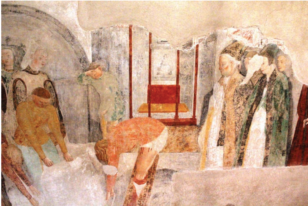
Fig. 4 Padova, Chiesa di Santa Giustina, cappella di San Luca, parete settentrionale, Giovanni Storlato, affresco, Inventio corporis di Luca evangelista nella cappella di S. Prosdocimo e di S. Maria .