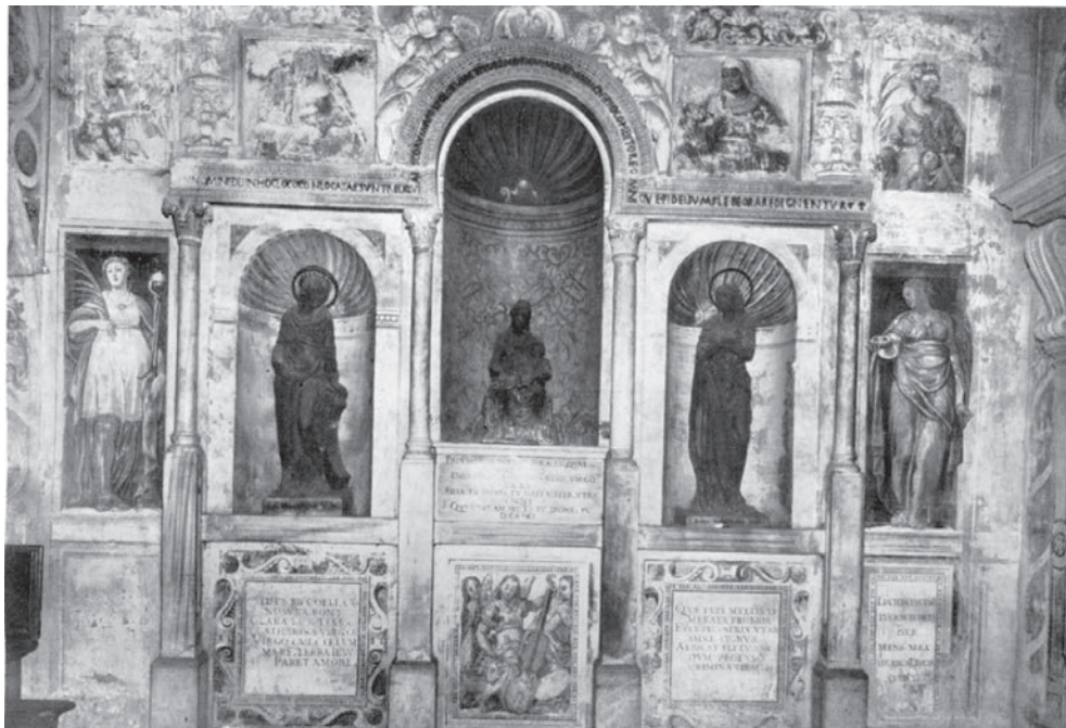
Fig. 5 Padova, Chiesa di Santa Giustina, corridoio dei martiri, foto, pergola (da Micheletto 1954).

esternamente poligonale, aperto da una finestra in posizione centrale. La presenza di questa apertura è documentata nella Cappella di San Luca in Santa Giustina, dove l'affresco di Giovanni Storlato del 1436, raffigura proprio L'inventio corporis di Luca evangelista nella cappella di S. Prosdocimo e di S. Maria 8 (fig. 4).