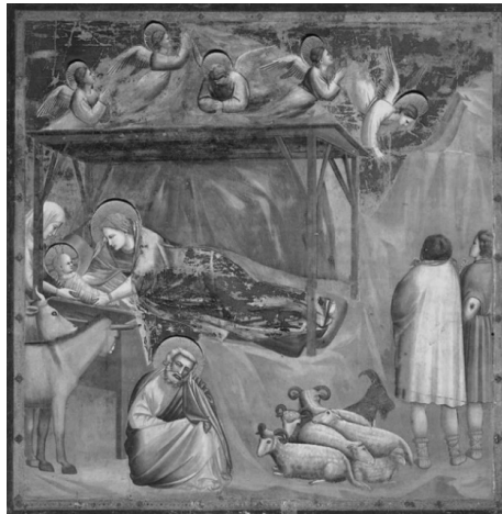
Figura n. 1: Natività di Gesù, Giotto

http://www.arteworld.it/wp-content/uploads/2015/02/nativit%C3%A0-di-Ges%C3%B9-Giotto-analisi.jpg