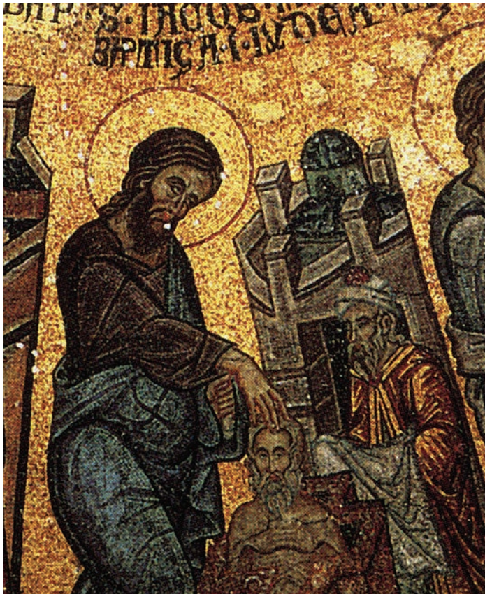
Fig. 6: San Giacomo Minore (immagine tratta da San Marco: Basilica patriarcale in Venezia: i mosaici, le iscrizioni, la pala d'oro, M. ANDALORO et alii (a cura di), Milano 1991, p. 186).