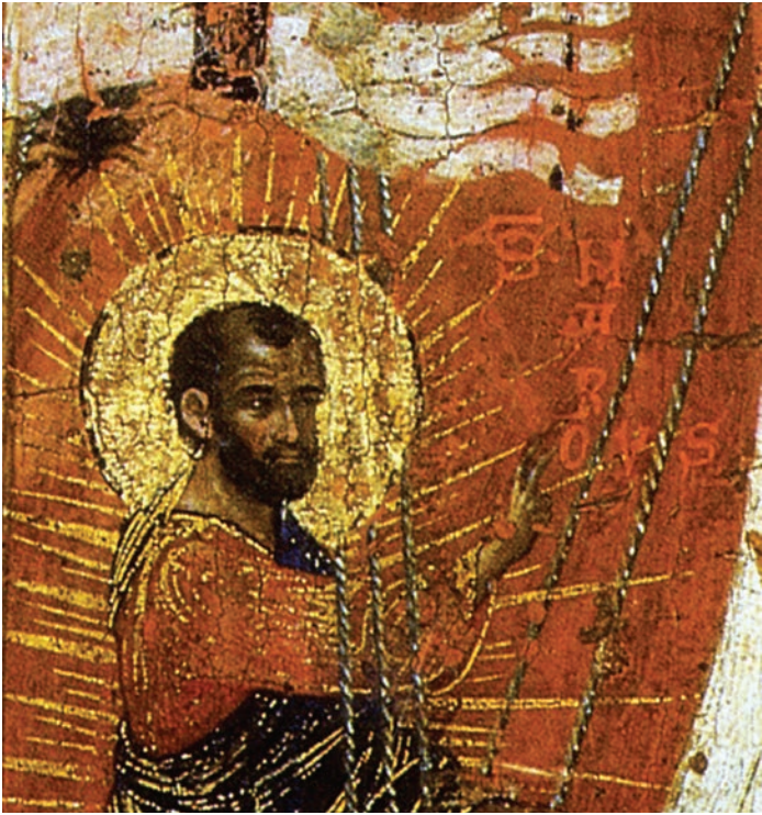
Fig. 3: San Marco (immagine tratta da La Pala d'oro , H. R. HAHNLOSER - POLACCO, Venezia 1994, tav. XC)

terza in cui Cristo gli appare in carcere; San Marco viene nuovamente accompagnato dall'iscrizione S(anctus) Marcus nella quarta scena, in cui si rappresenta il suo martirio, e nella quinta in cui salva dal naufragio l'imbarcazione destinata a trasportare le proprie spoglie a Venezia (fig. 3); l'iscrizione S(anctus) Marcus Ev(an)g(elista) compare anche nella sesta scena, in cui il corpo del santo viene ritrovato all'interno della basilica, e infine nella settima, in cui il sepolcro circondato dai fedeli recatisi in pellegrinaggio viene identificato dalla dicitura sepultura s(an)c(t)i Marci .