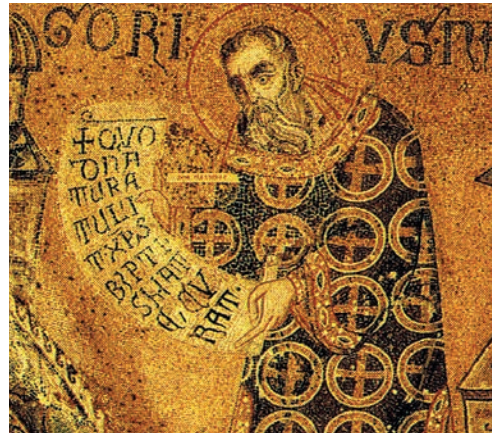
Fig. 15: San Gregorio di Nazianzo (immagine tratta da San Marco: Basilica patriarcale in Venezia: i mosaici, le iscrizioni, la pala d'oro, M. ANDALORO et alii (a cura di), Milano 1991, p. 187).