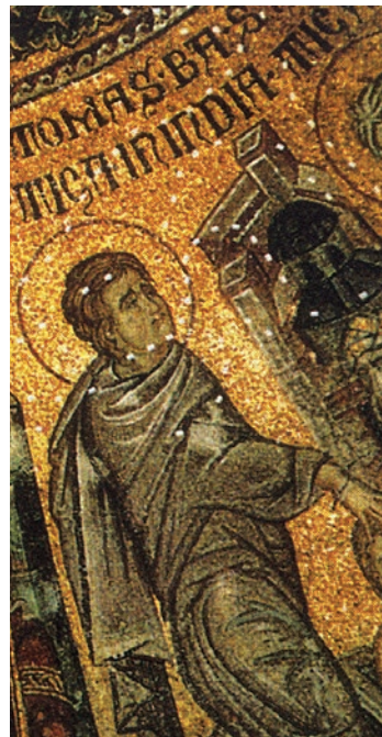
Fig. 9: San Tommaso (immagine tratta da San Marco: Basilica patriarcale in Venezia: i mosaici, le iscrizioni, la pala d'oro, M. ANDALORO et alii (a cura di), Milano 1991, p. 186).

S(anctus) Iacob(us) Minor in Giudea e in quella di S(anctus) Matheu(s) in Etiopia (fig. 6 e 7); all'interno del nome dell'apostolo Simon e in quello di Tomas (fig. 8 e 9); nel nome