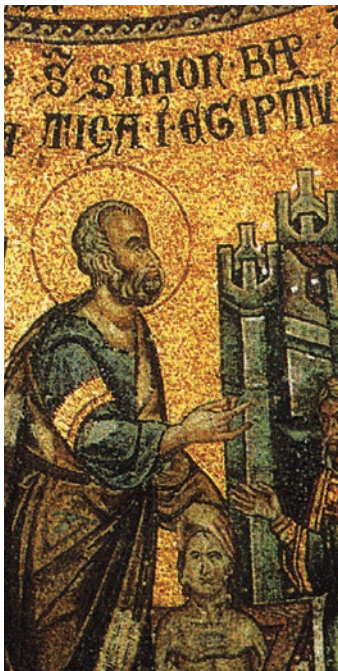
Fig. 8: San Simone (immagine tratta da San Marco: Basilica patriarcale in Venezia: i mosaici, le iscrizioni, la pala d'oro, M. ANDALORO et alii (a cura di), Milano 1991, p. 186).