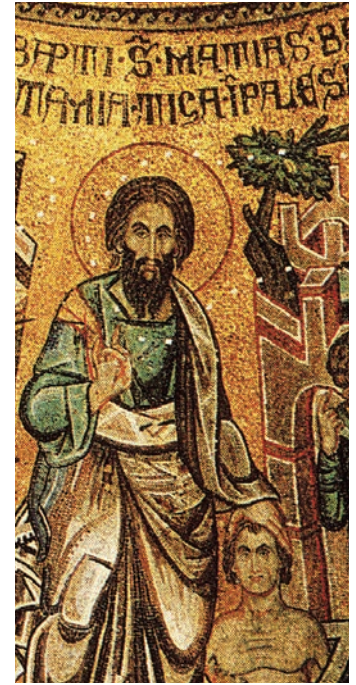
Fig. 13: San Mattia (immagine tratta da San Marco: Basilica patriarcale in Venezia: i mosaici, le iscrizioni, la pala d'oro, M. ANDALORO et alii (a cura di), Milano 1991, p. 186).