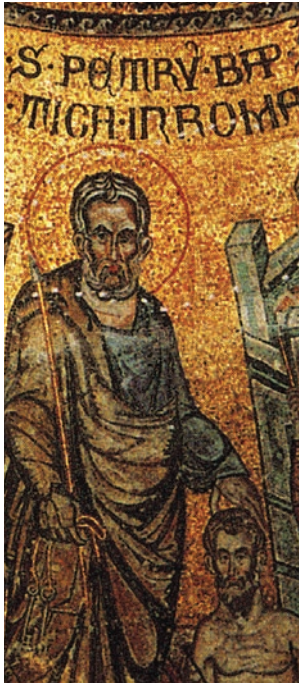
Fig. 10: San Pietro a Roma (immagine tratta da San Marco: Basilica patriarcale in Venezia: i mosaici, le iscrizioni, la pala d'oro, M. ANDALORO et alii (a cura di), Milano 1991, p. 186).