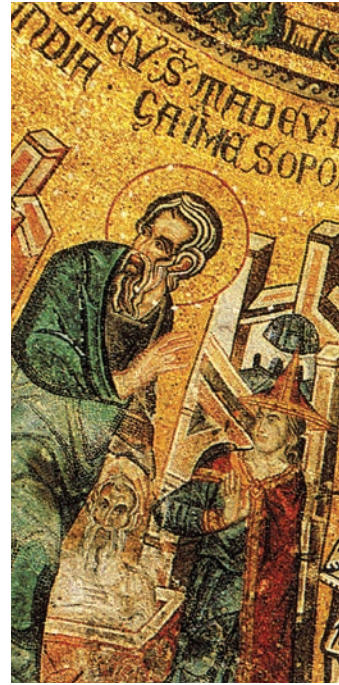
Fig. 12: San Taddeo battezza in Mesopotamia (immagine tratta da San Marco: Basilica patriarcale in Venezia: i mosaici, le iscrizioni, la pala d'oro, M. ANDALORO et alii (a cura di), Milano 1991, p. 186).