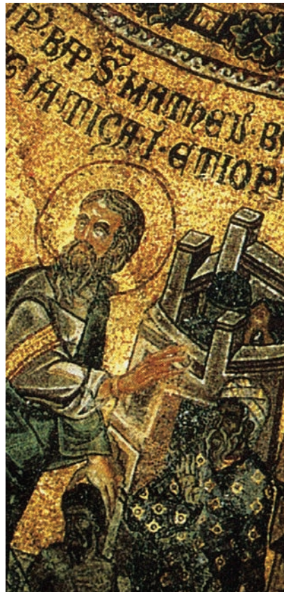
Fig. 7: San Matteo (immagine tratta da San Marco: Basilica patriarcale in Venezia: i mosaici, le iscrizioni, la pala d'oro, M. ANDALORO et alii (a cura di), Milano 1991, p. 186).