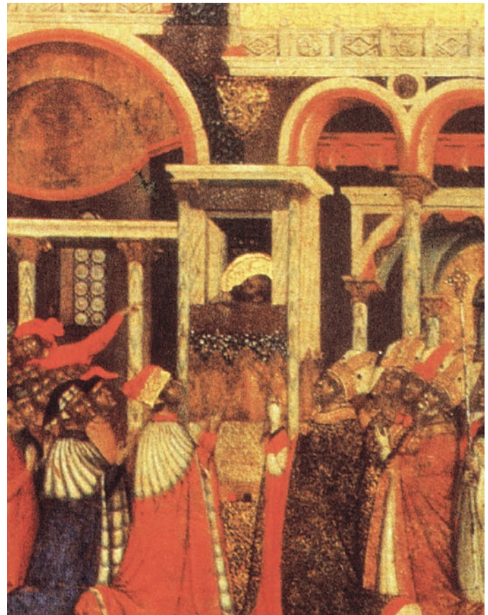
Fig. 2: Pala Feriale. San Marco rivolto verso il Doge (immagine tratta da La Pala d'oro , H. R. HAHNLOSER - POLACCO, Venezia 1994, tav. LXXXIX).

L'importanza significativa attribuita alla carica dogale appare evidente anche nella penultima scena della seconda fascia presente nella Pala Feriale, in cui alla sinistra di San Marco viene raffigurato il clero adorante, mentre il doge, i consiglieri e i cittadini si trovano a destra: il santo si rivolge proprio verso questi ultimi, confermando la posizione privilegiata del doge 17 (fig. 2). Non compare alcuna iscrizione identificativa, ma è verosimile riconoscere nell'immagine dogale un anacronistico Andrea Dandolo, che per altro sembra rievocare la figura in preghiera presente ai margini della Crocifissione, nel Battistero marciano 18 .