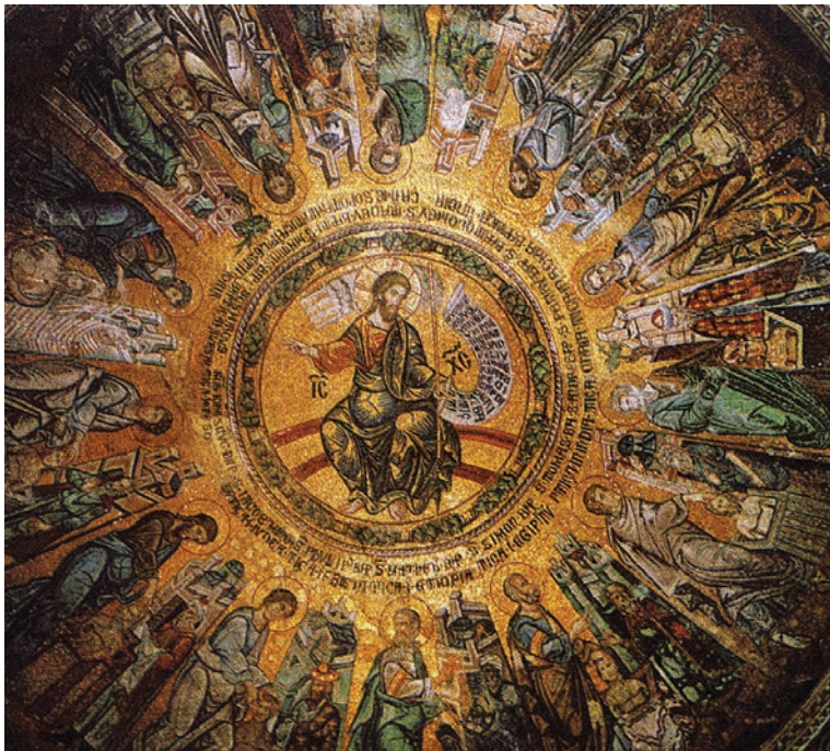
Fig. 4: Cupola sopra il fonte battesimale, Cristo e la missione apostolica