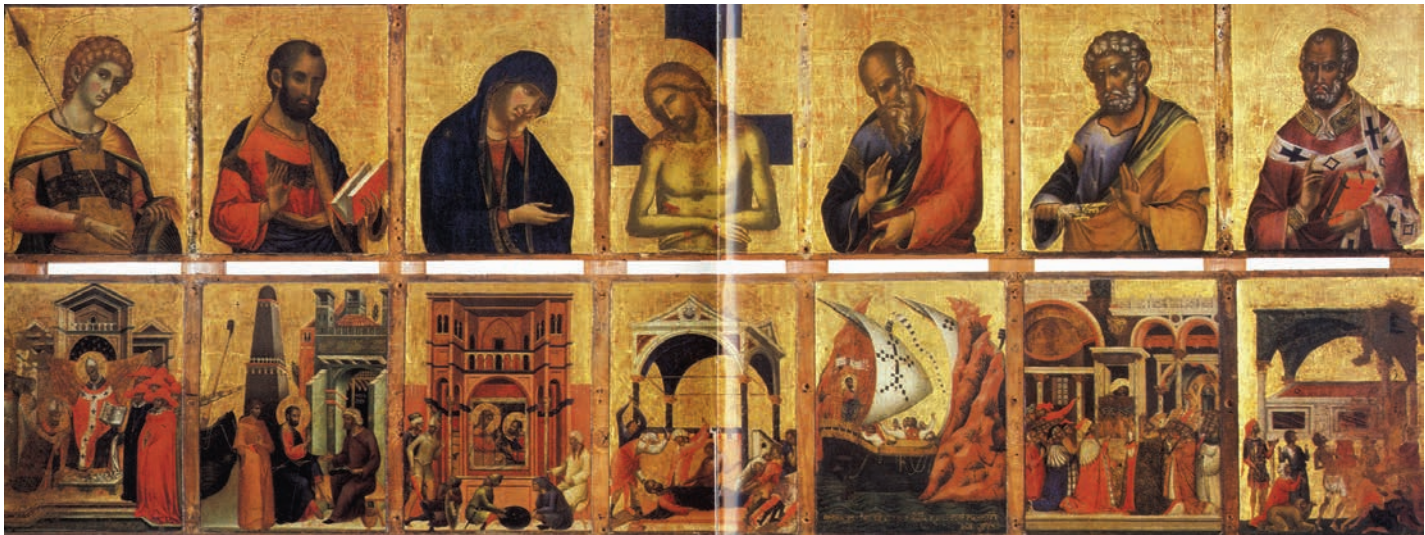
Fig. 1: Paolo Veneziano. La Pala Feriale (immagine tratta da La Pala d'oro , H. R. HAHNLOSER – POLACCO, Venezia 1994, tav. LXXXVII)

qualità di medium espressivo, perseguendo un intento di autorappresentazione che ha come fine la legittimazione del potere da parte dell'élite 7 .