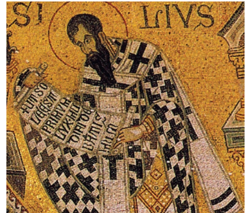
Fig. 16: San Basilio (immagine tratta da San Marco: Basilica patriarcale in Venezia: i mosaici, le iscrizioni, la pala d'oro, M. ANDALORO et alii (a cura di), Milano 1991, p. 187).

nel Mezzogiorno normanno 33 , in cui si suppone che l'utilizzo di iscrizioni in lingua greca e latina presenti nei contesti musivi all'interno degli edifici sacri sia connotato da significati politici; le scelte epigrafiche sembrano infatti strettamente relazionate con il processo di integrazione dello stato normanno nella cultura bizantina dell'occidente medievale. Se la lingua greca viene infatti impiegata inizialmente in modo preponderante nelle iscrizioni musive, lascia in seguito spazio a una coesistenza di greco e latino; una volta terminata la fase del consolidamento del potere normanno, la compresenza di