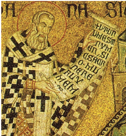
Fig. 14: Sant'Atanasio (immagine tratta da San Marco: Basilica patriarcale in Venezia: i mosaici, le iscrizioni, la pala d'oro, M. ANDALORO et alii (a cura di), Milano 1991, p. 187).