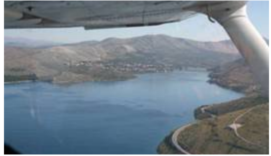
Slika 3. Avion

dan. Gumena brodica je dužine 5,5 m s motorom od 50 KS, jedrilica dužine od 7 i 12 m, a avion Cessna 175 kojim se letjelo na visini od 200 m (slika 3). Prebrojavanje dupina iz zraka pretraživanjem područja po dionicama provedeno je 29. listopada 2010. kad se preletjelo 338 km iznad mora Šibensko-kninske županije. Površina županijskog mora iznosi 2.680 km 2 . Prema Gomerčiću i suradnicima (1998.) letenjem na visini od 200 m sa svake strane aviona pregledava se 2 km površine mora. Prilikom obilaska akvatorija neposrednim promatranjem s objema brodicama utvrđeno je pojavljivanje morskih sisavaca na površini mora. Na svakoj je brodici uvijek bilo najmanje dvoje promatrača. U slučaju viđenja GPS opremom zabilježena je pozicija jata, a viđenje je fotodokumentirano digitalnim fotoaparatom. Podaci o pozicijama jata (datum, vrijeme, zemljopisni položaj) uneseni su u internetsku bazu podataka "CROdolphin" koja je dostupna na internetskoj adresi crodolphins.vf.hr .