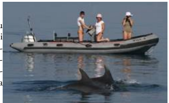
Slika 1. Gumena brodica

Neposredno promatranje morskih sisavaca u njihovu staništu zbog utvrđivanja pojavnosti i rasprostranjenosti provedeno je u razdobljima navedenim u tablici 1 u moru Šibensko-kninske županije. U tu je svrhu korištena gumena brodica (slika 1) devet dana, jedrilica (slika 2) deset dana i avion jedan