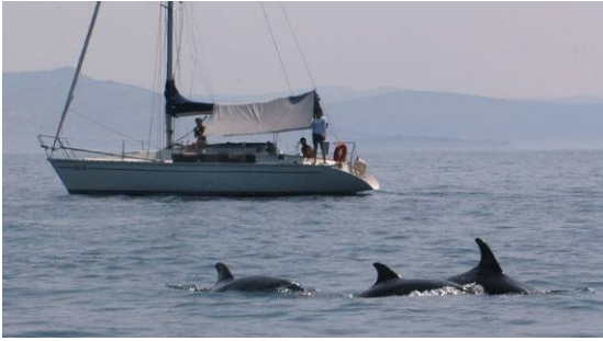
Slika 2. Jedrilica