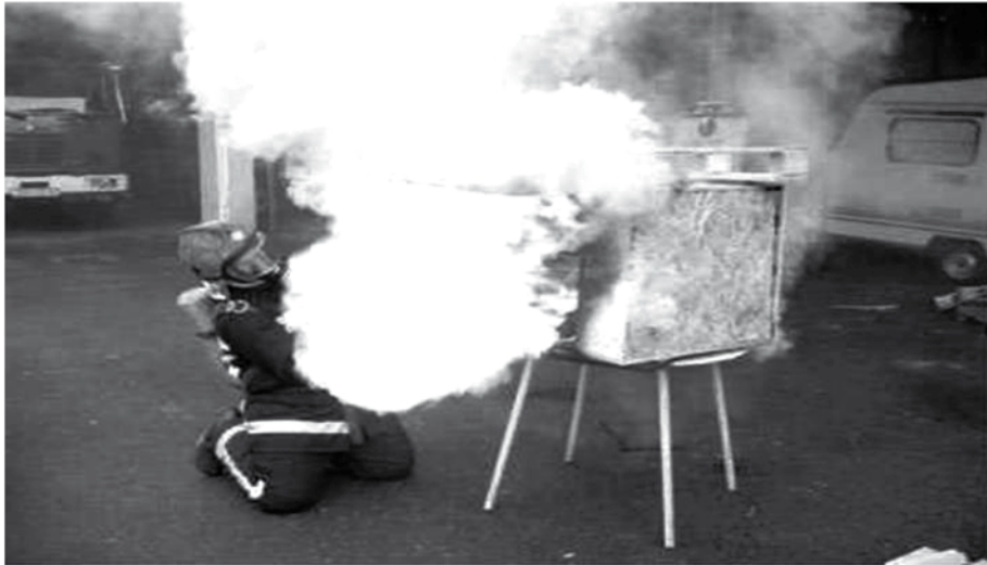
Slika 3. Faza "flash over" (JVP Ivanić)

Faza "flash over" može trajati i nekoliko sati ako zgrada ima visoko požarno opterećenje, tj. sve dok požar ne sagori sav gorivi materijal. Značajno je napomenuti da će se temperatura nakon one početne nagle faze razvoja polagano uspinjati do 1150 °C tijekom idućih nekoliko sati. Na osnovi ovoga može se predvidjeti trajanje požara, što upućuje na odabir građevinskih materijala za izradu objekta – odnosno njihovu vatrootpornost. Nosive građevinske konstrukcije trebale bi imati vatrootpornost toliko koliko bi požar trajao.