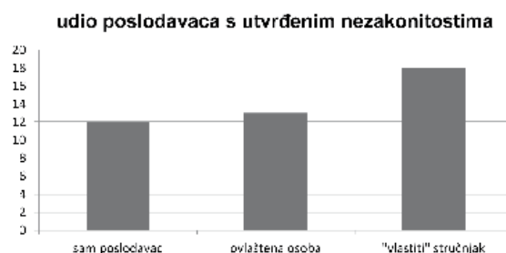
Slika 2. Udio poslodavaca s utvrđenim nezakonitostima

Dakle, ako pretpostavimo da je dosljednost u primjeni pravila zaštite na radu obrnuto propor-