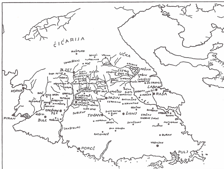
Slika 4. Razmještaj toponima iz Istarskoga razvoda (po P. Šimunoviću).