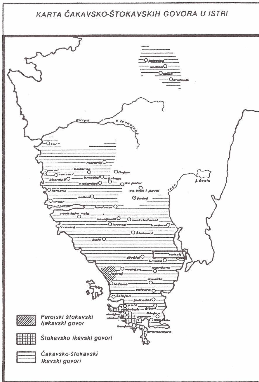
Slika 3. Rasprostriranje mlađega ikavskoga, “slovinskog” dijalekta u Istri.