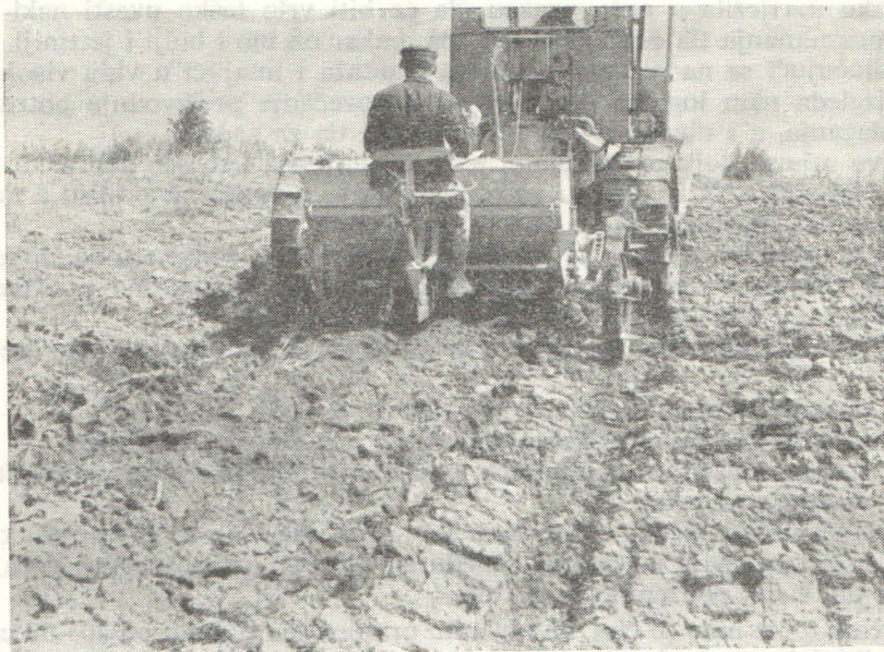
1. Podrivač (sous soleuse) s adaptiranim depozitorom (deep feeder) za mineralna gnojiva — u radu.

U traženju suvremenijeg načina pripremanja tla, prema kojem bi se izbjegle loše posljedice rigolanja kod podizanja voćnih nasada, prešlo se u nekim zemljama u svijetu (Francuska, USA, i dr.) na podrivanje tla upotrebom podrivača (sous soleusa).