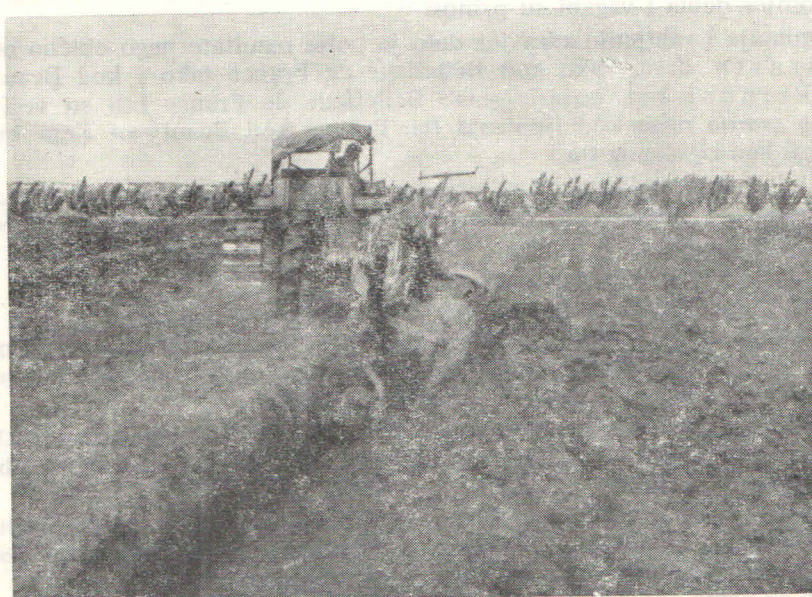
4. Rigoler u radu