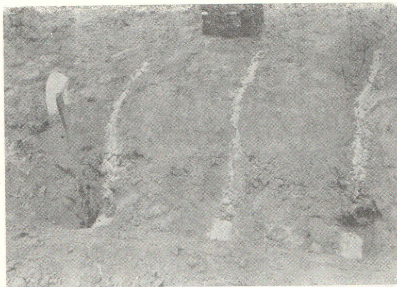
2. Kontrola rada podrivača

Na podrivač je adaptiran depozitor (deep-feeder) za mineralna gnojiva koji je ugradio strojarski majstor Ivan Jamuljak iz Našica. Sadržina sanduka depozitora je 300 kg mineralnih gnojiva.