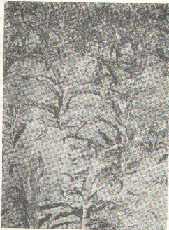
Slika 1. Smanjeni postotak nicanja i nejednolični razvoj biljčica kukuruza

U usporedbi rezultata pokusa opaža se također, da je sjemenski materijal jednakog genetskog potencijala i starosti, ali proizveden kod različitih proizvođača dao signifikantne razlike u visini priroda. Tako su se npr. takve