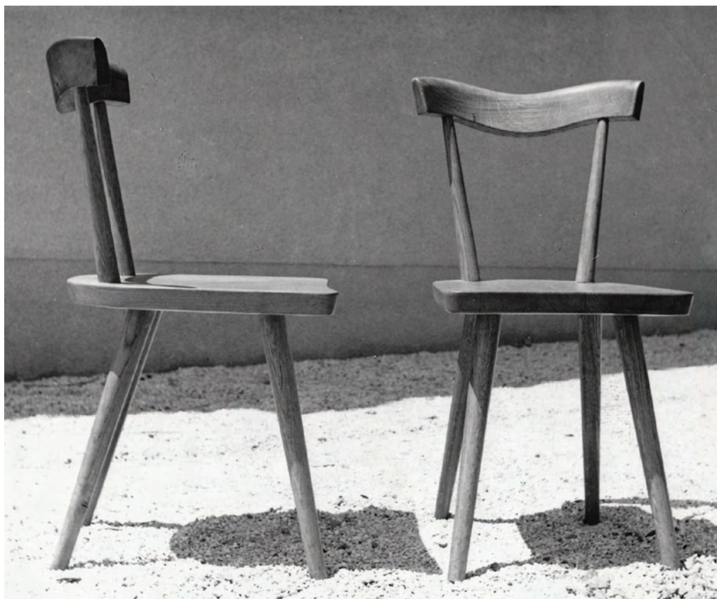
Akademik Miroslav Begović; Stolice

Intervencije u zatvorenome i otvorenom prostoru i projekti koje je Begović ostavio, nastavak su ideja koje su hrvatski arhitekti opredmetili u realizacijama početkom dvadesetoga stoljeća, a kasnije su razvijene i nadograđivane u uvjetima rasta i razvoja društva, politike i ekonomske moći države. Većina Begovićeva opusa smještena je između početka šezdesetih i kraja osamdesetih godina, odnosno glavnina njegova djelovanja vezana je uz vrijeme koje je zbog političkoga značaja moralo težiti napretku i unošenju novoga, snažnoga i kvalitetnog izraza u arhitekturu. Snažno naglašena likovnost koju je interpretirao kroz svjetlo i njegove učinke na arhitekturu gledanu okom skulptora, još je jedan u nizu elemenata koji se vežu uz kontinuitet kvalitete stvaralaštva hrvatskih arhitekata tijekom dvadesetoga stoljeća. Kontinuitet je tu, arhitektura začeta na blistavim postulatima moderne trajala je i dalje, mirno plovila kroz kabinete fakulteta, zadržavala se na „plahtama“ pauza i ponekad i negdje izrastala u kuću, galeriju, hotel. Njegova arhitektura rezultat je iznimne stvaralačke sposobnosti, a projekte karakterizira logič-