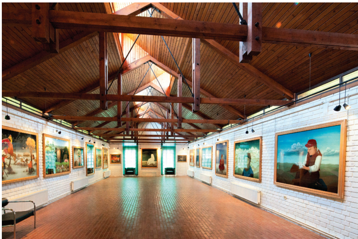
Akademik Miroslav Begović; Galerija Hlebine