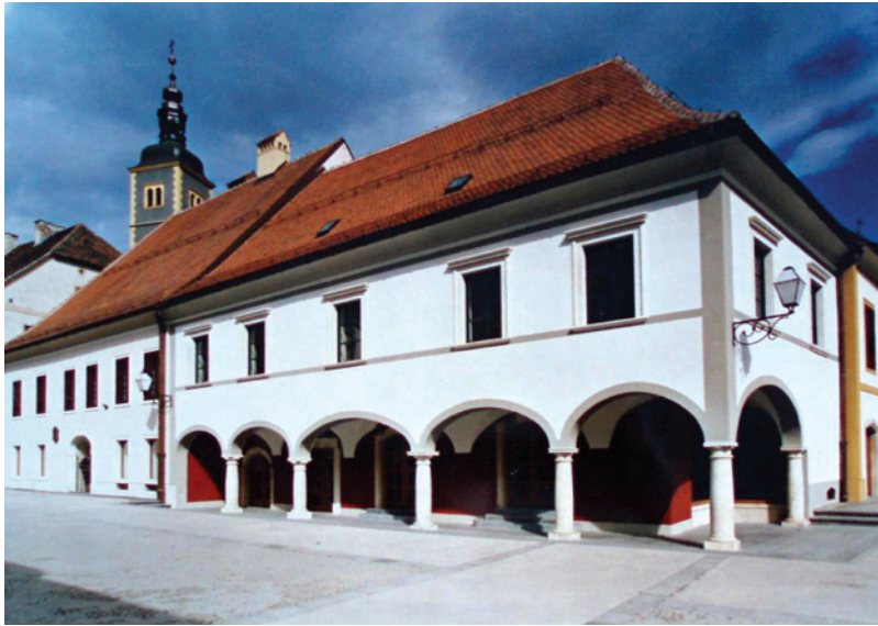
Akademik Miroslav Begović; Varteks

Kroz dugi niz godina razvijao se kao arhitekt kroz ispitivanje i traženja najboljega primjenjivog za određenu lokaciju u okvirima suvremene arhitekture, a