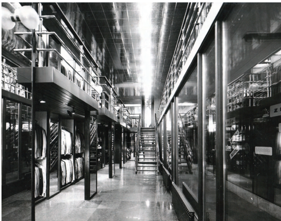
Akademik Miroslav Begović; Varteks interijer

Arhitektura kao materijalna potvrda društva uvijek se nalazi na raskrižju potrebe, imaginacije, želja i mogućnosti 3 . Trebalo je u određenome trenutku znatne snage, kako intelekta, tako i umjetničkoga dara da se iz raskrižja izade zadovoljan ostvarenim, pa makar se to danas nalazilo samo na skici, duboko zakopano pod hrpama papira koji su nijemi svjedoci vremena. Begović je jedan od protagonista hrvatske arhitektonske scene druge polovine dvadesetoga stoljeća koju je obilježio s nekoliko recentnih ostvarenja. Antoaneta Pasinović svrstava ga u red arhitekata koji uz značajnu teorijsku podlogu imaju specifičan i individualistički pristup prema problemu suvremenoga prostora 4 . Taj specifičan i individualan pristup posebno je vidljiv u snažnome prostorno-plastičkom izrazu koji koristi na gotovo svim projektima. Raznolikost interesa i razvojni put Begovića vidljivi su na ostvarenjima koja su svoje mjesto našla kako u postojećim povijesnim cjelinama, tako i u slobodnome prostoru kojemu je trebalo odgovoriti poštivajući sve elemente prirodnoga okruženja i konfiguracije terena.