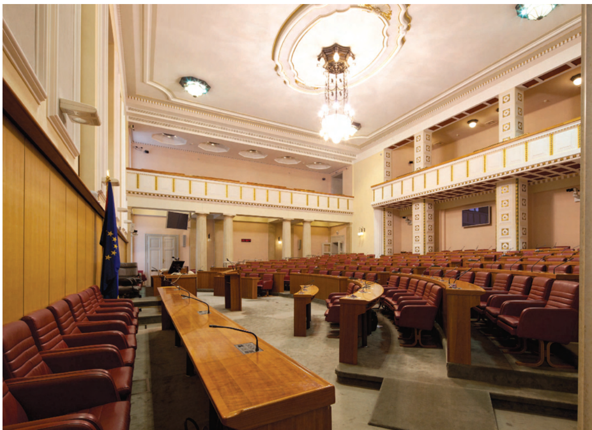
Akademik Miroslav Begović; Sabor Republike Hrvatske

na dispozicija i racionalna konstrukcija koja uz jasan koncept i skladno oblikovanje koristi sve novo što znanost i tehnika pružaju svakim danom u sve većoj mjeri.