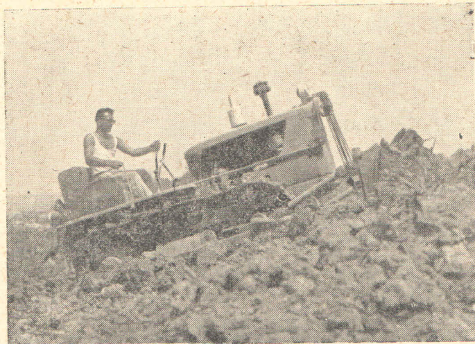
Sl. 2. Buldožer TG 50 s mehaničkim komandama u radu

tlo sa snagom od 63 KS, u stanju je da izvrši transport pod bilo kakvim režimom i uslovima (blato, snijeg, led i sl.), uz povoljne materijalne troškove.