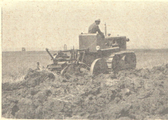
Sl. 1. Traktor gusjeničar TG 50 u radu

Prema opremi kako u navodu stoji, traktorom TG-50 je moguće prodrijeti i u tehnologiju građevinarstva, što praktično može korisno poslužiti i poljoprivrednicima.