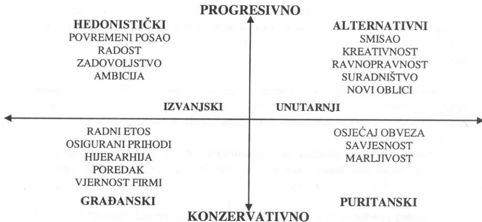
Slika 4. Psihološka karta Europljana