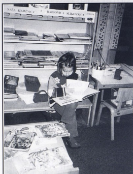
DV Velika Gorica; Skupili smo super slikovnice