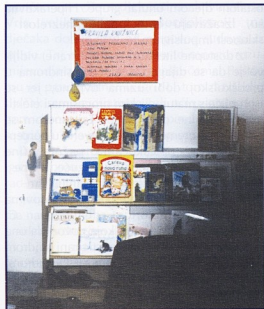
Knjižnica u DV Krijesnica, Rijeka