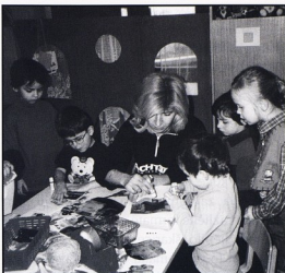
DV Velika Gorica; I mama nam pomaže

Nakon posjeta knjižnici, u dogovoru s djecom oformila sam novi centar u sobi dnevnog boravka. Polica koja je u plavoj kućici služila za kreativne igre pretvorila se u knjižnicu s postojećim slikovnicama u skupini. Nekoliko dana djeca su se igrala prema svojim zamislima, slobodno stvarajući što i kako žele. Nakon dogovora s djecom i obavijesti koje sam stavila u roditeljski kutić, počele su stizati u našu knjižnicu raznovrsne knjige i slikovnice. Čitajući i pričajući po slikama djeca su proširila svoje spoznaje, bogatila rječnik ...Svakodnevno sam pratila dječju igru u našoj knjižnici, njihova razmišljanja, proces spoznavanja i želju za istraživanjem. Sve se to svakodnevno mijenjalo. Djeca su pokazala interes da iz naše knjižnice posuđuju knjige koje će im roditelji čitati u roditeljskom domu. Zajedno smo