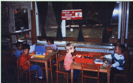
CPO Kvarner Rijeka