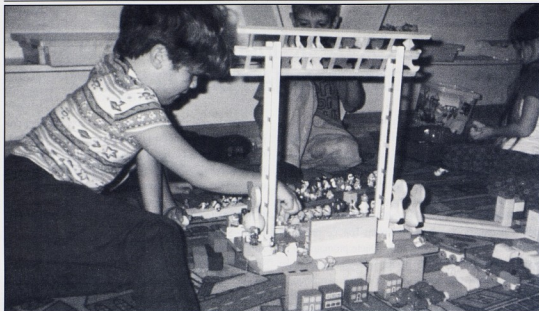
DV Oršula, Šibenik, Centar za građenje

Prilikom pisanja zapažanja o djetetu, potrebno je voditi računa o činjenici da je svaka opisna ili pripovijedna bilješka samo jedan dio konačne zbirke podataka o djetetu. Odgajateljima-promatračima će se ponekad dogoditi da u prvi mah, kod kasnijeg čitanja, ne shvate značenje svakog pojedinog zapisa, a možda će i promijeniti mišljenje o nekom djetetu nakon više zapisa i prikupljenih činjenica.