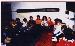
DV Radost, Selce: Jutarnji razgovori

Drugo, potražite tradicionalni materijal; mitove, legende i priče iz narodne baštine. Općenito govoreći, što je priča starija to je bogatiji unutarnji sadržaj. Vjerojatno u svim tim likovima nalazimo dualizam koji možemo naći u nama samima pa je to razlog zašto su te priče ostale tako popularne. Dobru priču možemo prepoznati, ako oстане u sjećanju nakon nekoliko čitanja. Potražite priče koje ne pripovijedaju već govore o nekoj unutarnjoj istini.