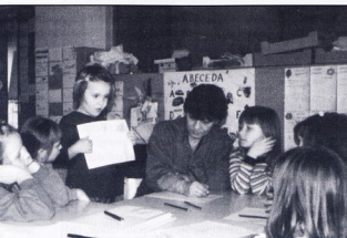
DV Mrav, Mačkovec

neuključenog. To je zbog toga što osoba u jednom potezu može biti kratko emocionalno uključena. Vrlo emotivni trenuci moraju biti u ravnoteži s onima manjeg emotivnog utiska, kako bi publika imala priliku uloviti dah. Neuspjeh stvara situacije prevelike stimulacije gdje publika postaje bezosjećajnom i emotivno udaljenom od priče. Zaplet s neprekidnim nasiljem, na primjer, postaje monotonim, čak i dosadnim, ako ne postoje prekidi u akciji. Zapamtite da svaki napeti trenutak treba uvod, poantu i emocionalnu stanku. Ideja je naglasiti svaki emotivni dio do kraja i stvoriti slušateljevu emotivnu angažiranost. Ovdje je dobro sjetiti se roller-coastera. ("tobogan smrti" u zabavnim parkovima).