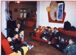
CPO Zamet, DV Mlaka, Rijeka: Posjet Gradskom kazalištu lutaka

Tijekom čitanja važno je voditi računa o psihološko-spoznajnim elementima, tj. paziti na dob i psihičku strukturu djeteta iskustva, emocionalna osjetljivost, motiviranost ..., kako ne bismo izazvali pretjeranu emocionalnu reakciju. Što je dijete mlađe, to bi priča trebala biti kraća i jednostavnija, puna lijepih slika koje djetetu pomažu da si jasnije predoči moguće komplikiranije pojmove.