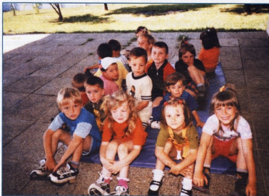
DV Mrav, Mačkovec