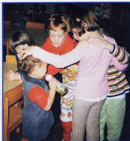
Veliki tješe male

Kao što pratimo reakcije djece, tako pratimo i reakcije roditelja. Većina je roditelja zadovoljna i podržava ove promjene, no ima i onih koji to promatraju s nevjericom. Ne mogu se naviknuti da djeca nemaju svoju (jednu) "tetu". Novoj organizaciji rada prilagodili smo i naše radno vrijeme tako da sada imamo četiri smjene, koje svaki odgajatelj odradi u toku jednog mjeseca. Nije uvijek ista osoba kod jutarnjeg prijema, niti uvijek ista osoba radi s nespavačima. Mišljenja smo da je dobro da se dijete ne vezuje samo za jednog odgajatelja, već je dobro da ima više osoba s kojima kon-