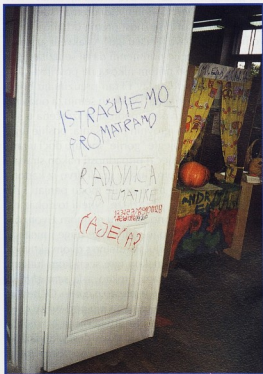
Ulaz u radionicu matematike