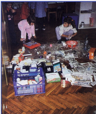
Radionica raznovrsnim materijalima

Kako bi se ostvarile postavljene zadaće i cilj potrebna je podrška svih djelatnika, odgajatelja i tehničkog osoblja koji će sudjelovati u projektu, a radi zajedničkog praćenja i analiza koje će se raditi kontinuirano u suradnji sa stručnim timom. Odlučili smo da se ovakav pristup počne ostvarivati, iz ranije navedenih razloga, u vrtiću Volosko koji djeluje u sklopu Dječjeg vrtića "Opatija" i ima