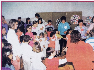
Djeca i roditelji u igri "Balon putuje"

Kako bih doznala što o tim svečanostima misle djece i to ona koja su sad već u 3., 4., 5., 6. razredu osnovne škole, pitala sam ih "čega se najviše sjećaju s priredbi u vrtiću" - znači što se dugo pamti i nosi u život, dali su sljedeće odgovore: