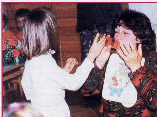
"Kad ste mali bili, čaj ste iz boce pili"