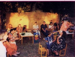
Roditelji i djeca na završnoj svečanosti