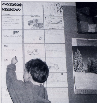
DV "Mrav", Čakovec

dovodi do neugode i napetosti ruke. Stoga treba povremeno uvoditi vježbe opuštanja i razgibanja te već u predškolskoj dobi upućivati na pravilan položaj lijeve ruke kod crtanja i pisanja.