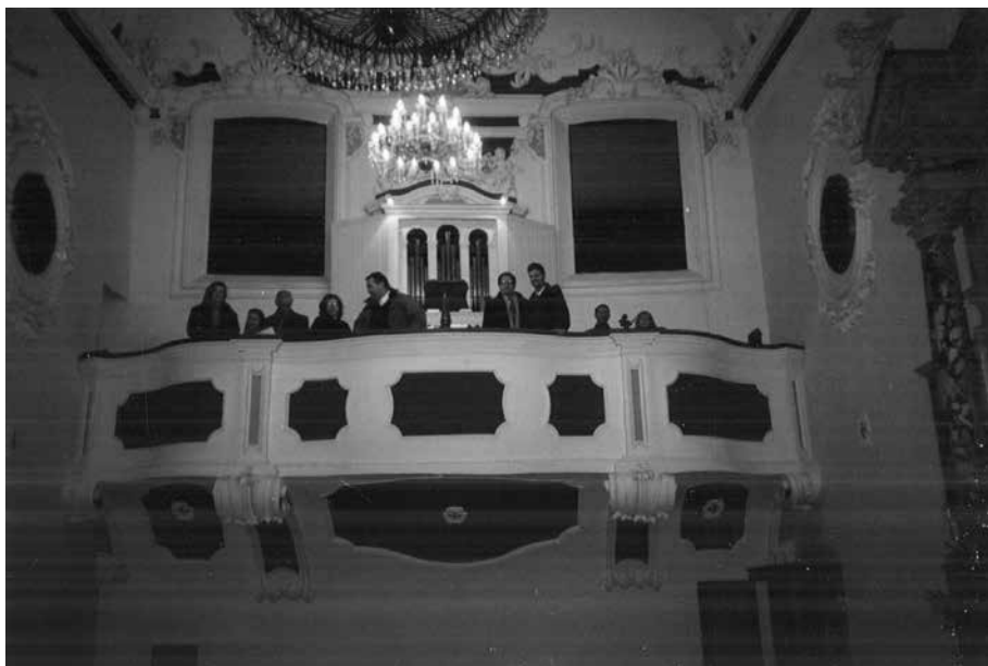
Članovi zbora i solisti na koru crkve sv. Nikole u Trogiru 1998.