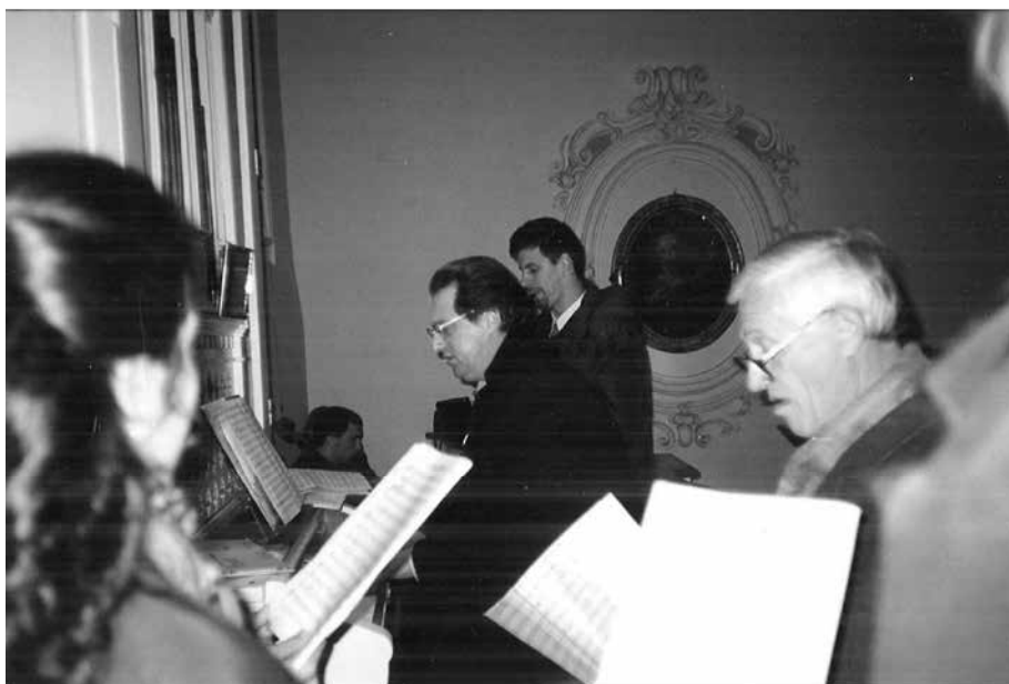
Badnja večer, 1998.