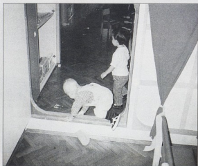
sl10b DV Pula