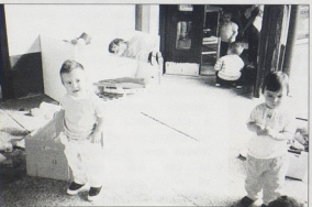
sl.9b DV Rovinj