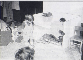
sl.9a DV Rovinj