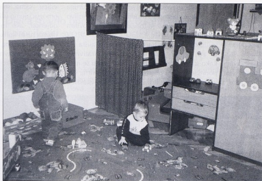
sl.1b DV Mali Princ

Suvremene koncepcije odgoja i obrazovanja, a sukladno tome i arhitektonska rješenja, u novije vrijeme zagovaraju drukčiji pristup. Pristup kojim je sve podređeno djeci, njihovim potrebama i interesima, njihovom življenju i učenju, iako se i odrasli u njima moraju dobro osjećati. To su drukčije koncepcije jer se iz temelja promijenila koncepcija ili slika o djetetu, njegovim mogućnostima i načinu nje-