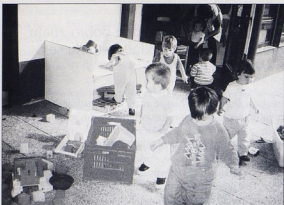
sl.8 DV Rovinj