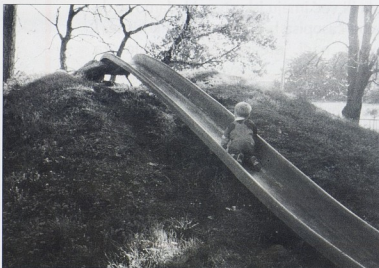
sl.2 DV Poreč, penjanje na tobogan

Naša je slika ili teorija o djetetu, njegovom razvoju, sposobnostima pa i mogućnostima učenja često jedna tradicionalna, konzervativna slika. Tradicionalna jer dijete doživljava-mo kao bespomoćno biće, biće koje u svemu ovisi o odrasloj osobi. Biće koje ne može procijeniti svoje realne mogućnosti, koje uči jedino onda i jedino na način kad ga odrasla osoba izravno poučava. Biće u kojeg odrasla osoba nema povjerenja. Jer «ako ga ne držim na oku, tko zna što bi mu se moglo dogoditi ili što bi mogao učiniti drugima». Takva je tradicionalna slika o djetetu vrlo prisutna ne samo u našim vrtićima nego i u svijetu. Rezultirala je arhitektonskim projektima zgrada vrtića, i škola također, koje više sličje tvornicama, ili kutiji za jaja, nego odgojno-obrazovnim ustanovama. Standardni dugački hodnici iz kojih se ulazi u sobe dnevnog boravka ili učionica, koje obavezno imaju zatvorena vrata da se djeca ne bi miješala i/ili ometala odgojno-obrazovni rad. Djeca se u njima osjećaju zatvorenima kao u košnici. U školama su tu još i povišene katedre - da se zna tko je šef, poredane klupe jedna iza druge itd. U vrtićima pak prostor je