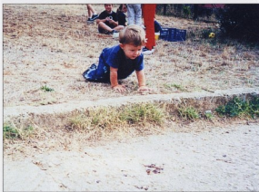
sl.7 DV Rovinj, samostalno svladavanje prepreka

Kad se djeca osjete slobodnima, u granicama dopuštenog, tj. kad shvate da njihovo ponašanje i njihova sloboda ne smiju ugrožavati slobodu druge djece, prakticirajući takvu slobodu i odgovornost svakodnevno, od prvog dana dolaska u vrtić, događaju se postignuća djece koja nas svakodnevno iznenaduju. U sljedećem broju časopisa Dijete, Vrtić, Obitelj bit će više riječi o takvim postignućima starije djece.