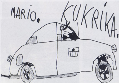
Naš autobus obilazi sela i skuplja djecu!