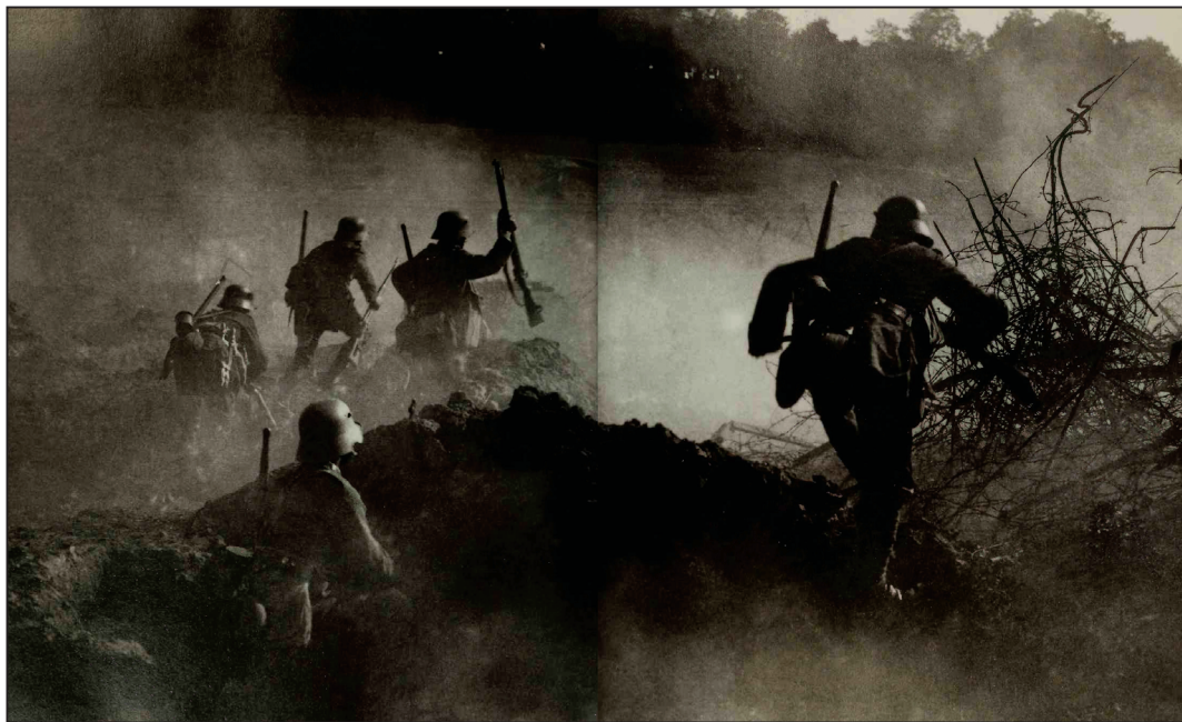
Slika 4. Jurišnici u napadu

svesti na nekoliko ključnih komponenti: kratko i intenzivno topničko bombardiranje, napredovanje jurišnih postrojbi s uporabom punoga spektra dostupnoga naoružanja, izbjegavanje protivničkih jakih utvrđenih položaja u korist onih slabije branjenih te, konačno, prodor u neprijateljsku pozadinu s ciljem remećenja i onesposobljavanja protivničkih linija komunikacije i opskrbe. 59 Načelo djelovanja opisano u nastavku teksta odgovara taktici koju su jurišne postrojbe primjenjivale u operacijama širih razmjera u završnim fazama rata, posebice u Proljetnoj ofenzivi 1918. godine.