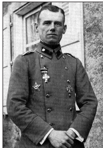
Slika 2. Satnik Wilhelm Rohr, jedan od začetnika nove pješačke taktike

Formiranje jurišnih postrojbi u ranoj fazi bit će dodatno ubrzano prenamjenom postrojbi dviju već postojećih formacija unutar Njemačke carske vojske koje su i same imale tradiciju uporabe taktika s manjim jedinicama, decentraliziranoga vodstva i osobne inicijative: Jäger postrojbi i postrojbi