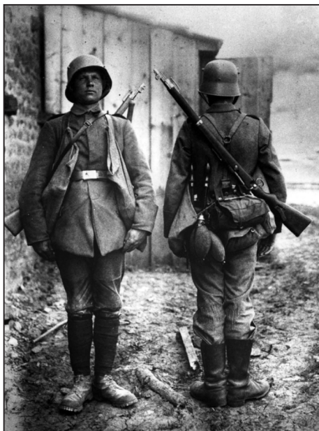
Slika 3. Pripadnik jurišnih postrojbi (slika preuzeta iz: H. H. HERWIG 2014: 254.)

„Morali smo nositi strojnice i bacati ručne granate, napredovati u jarcima i puzati bez zvuka. U početku, ovo mi je predstavljalo velik napor. Neprestano sam se znojio i okolina mi je nekoliko puta iščeznula iz vida, ali samo na trenutak. Poslije mi je svakim sljedećim danom postajalo sve lakše. Obuka je trajala od jutra do večeri, sa samo dva ili tri sata predviđena za ručak. Nisam imao vremena razmišljati i osjećao sam se udobno.“ 62