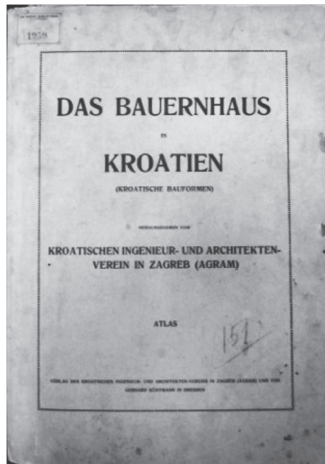
Sl. 3 Das Bauernhaus in Kroatien (Kroatische Bauformen) – Atlas