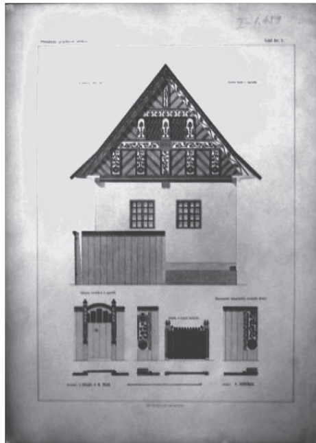
Sl. 2 List 1 (Kuća br. 82 u Kraljevcima)