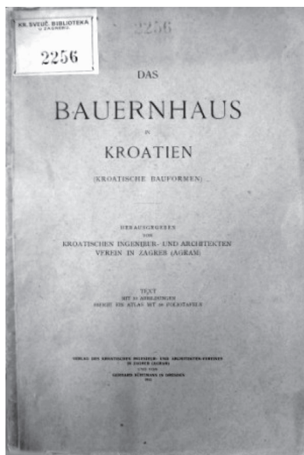
Sl. 4 Naslovnica popratnog teksta Martina Pilara na njemačkom jeziku uz ediciju Das Bauernhaus in Kroatien (Kroatische Bauformen)