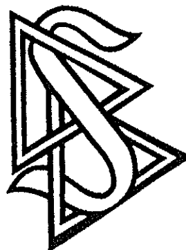
Scijentološki zaštitni znak