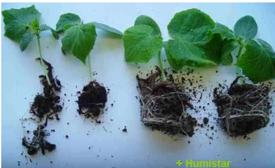
Slika 3. Utjecaj huminskih kiselina na razvoj korijena presadnica krastavaca