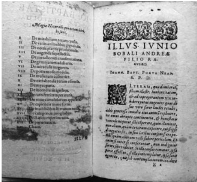
Ioephus, Flavius, Flavii Iosephi des Hochberuehmten Juedischen Geschichtsschreibers Historien und Buecher ..., Strassburg, 1595. (Čakovec: RIV-4°-4)