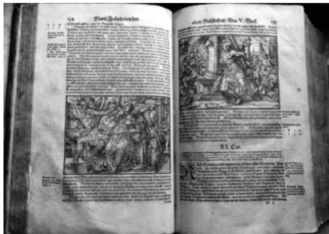
Johannes Curio, Conservandae bonae valetudinis praecepta longe saluberrima, Regi Angliae quondam a Doctoribus Scholae Salernitanae versibus conscripta: ... Franc., 1568. (Čakovec: RIV-m8 o -1)

U većini knjiga nalaze se dobro čitljivi rukopisni ex libris ili zapisi drugoga karaktera. Najveći broj knjiga u dobrome je stanju, a nekoliko njih je zadnjih godina i uspješno restaurirano. Ipak sasvim mali broj knjiga još uvijek je u lošem stanju, razbijen im je knjižni blok i oštećene kožne korice. (Čakovec R IV.- 16 o -1), što je posljedica trajnoga korištenja i neadekvatnoga smještaja tih knjiga tijekom prohujalih stoljeća.