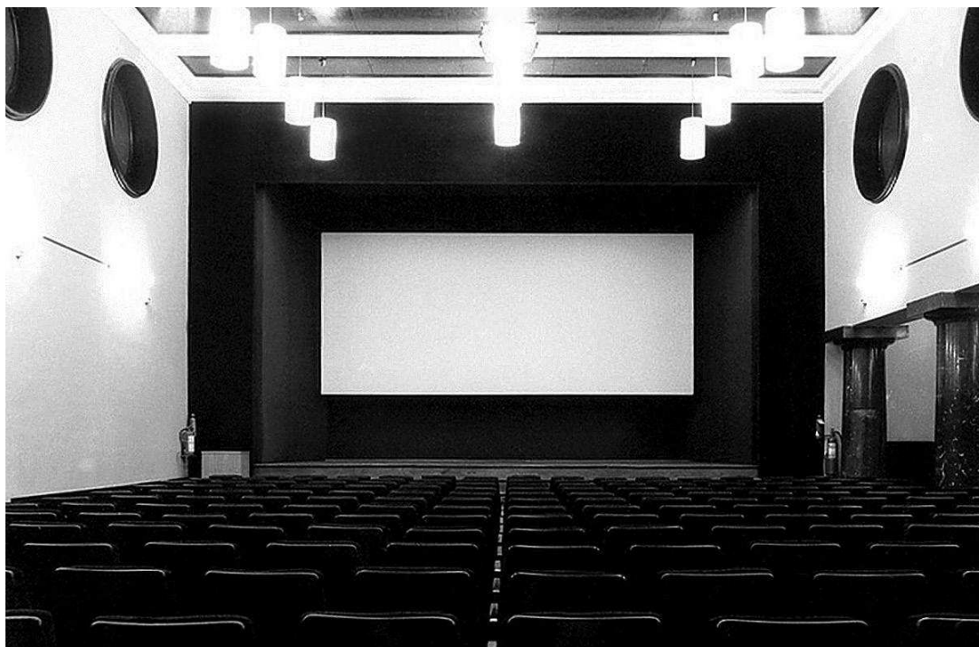
sl.2. Dvorana 1993. godine

Drugi temelj za nastanak Slovenske kinoteke bila je zbirka predmeta i građe filmske baštine koja je nastajala unutar Filmskog muzeja. Muzej je ustanovilo Društvo slovenskih filmskih radnika 1973., a 1979. spojio se sa Slovenskim kazališnim muzejom, koji je kao Slovenski kazališni i filmski muzej djelovao sve do osnutka Slovenske kinoteke.