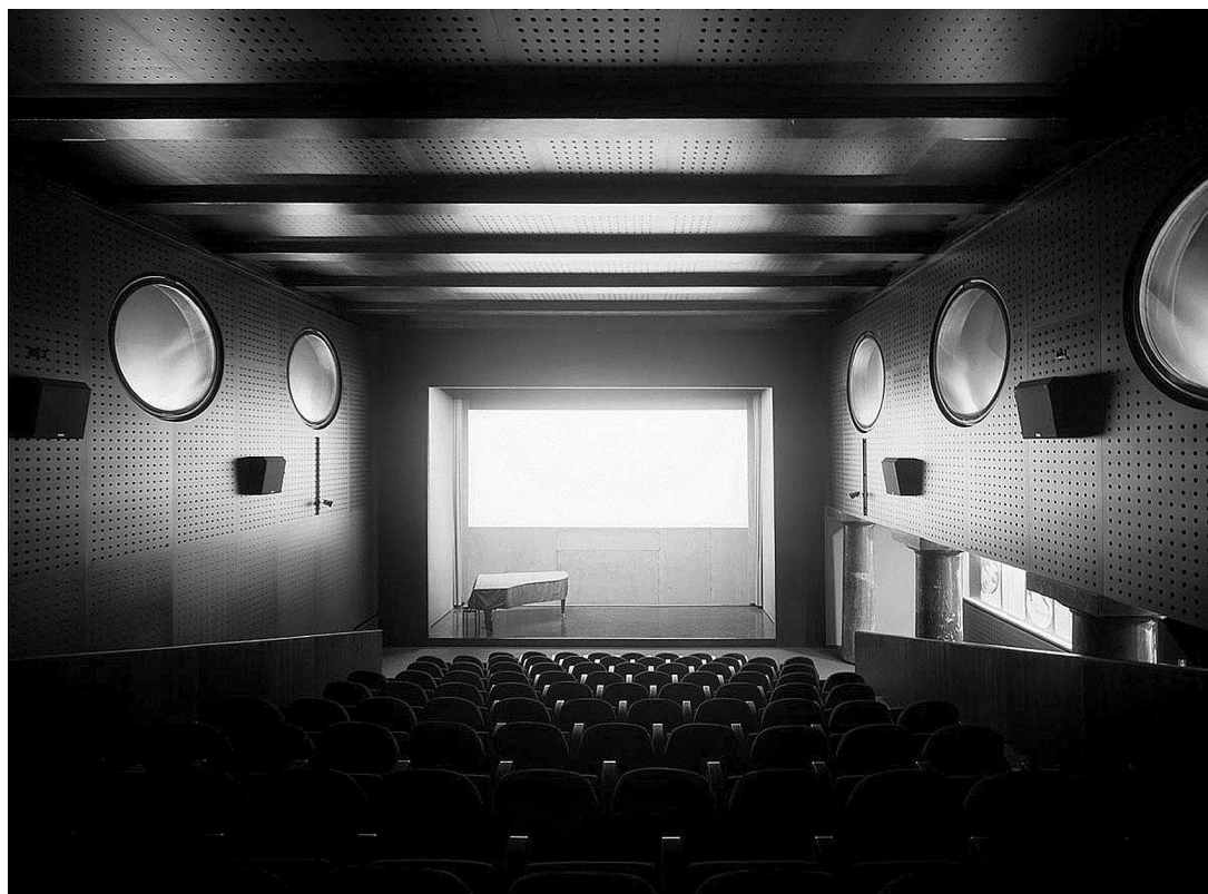
sl.1. Dvorana Slovenske kinoteke danas

METKA DARIŠ □ Slovenska kinoteka - Muzejski odjel, Ljubljana, Slovenija