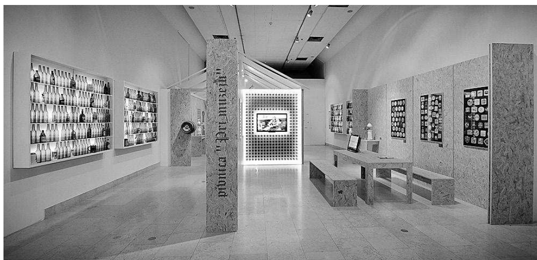
sl.3. Izložba Idemo na pivo! , Etnografski muzej u Zagrebu, 2012.

9 Film Karneval Kralj Europe Giovannija Kezicha i Michelea Trentinija dobio je nagradu za najbolji znanstveni film na Festivalu etnografskog filma u Kyotu 2009.