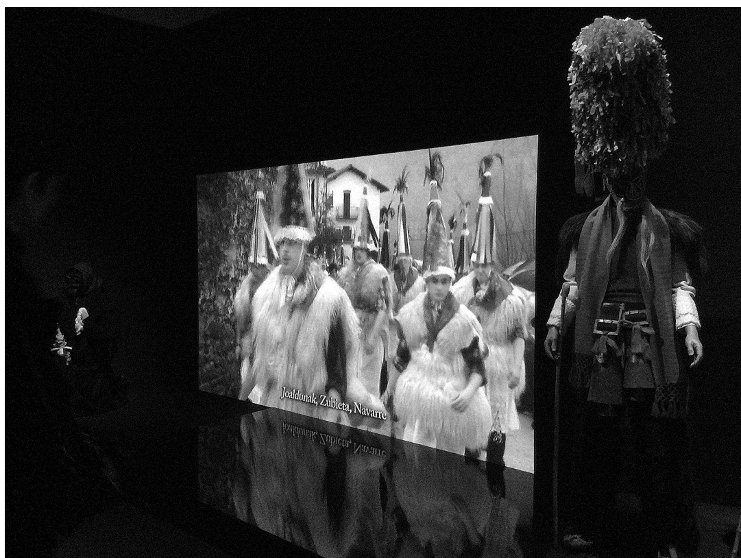
sl.1. Izložba Svijet naopačke! , 2014. MuCEM - Musée des civilisations de l'Europe et de la Méditerranée

1 U Etnografskom muzeju u Budimpešti, Parizu, Ljubljani, Trentu i Skopju zaposleni su kolege koji su po struci etnolozi i koji snimaju, montiraju i često sami režiraju filmove.