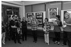
sl.6. Izložba fotografija Drugi svjetski rat – na drugi način .