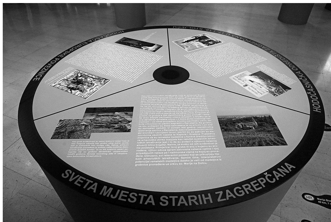
sl.1-4. Izložba "Sveta mjesta starih Zagrepčana – hodočasnička odredišta Zagrepčana u 17. i 18. stoljeću", Muzej grada Zagreba