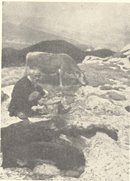
Sl. 2. Kamenice na stijeni, iz kojih napajaju stoku

Pašnjaci u ovoj zoni su na proplancima i čistinama u prorijeđenim šumama. Pored trave za ishranu stoke na ovim pašnjacima koristi se i plodove šumskog drveća, već prema tome, kakva je sastojina šume, u kojoj se koriste šumski pašnjaci.