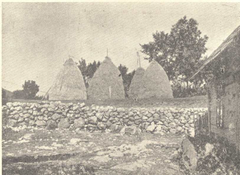
Sl. 5. Lijepo uređena seljačka kotarina. Selo Konpolje, T. Korenica.

1. Krumpir — bijele žitarice (jare) — crvena djetelina i prirodne livade — goveda (uzgojna) — konji (radni) — svinje (za tov) — perad. Tržni viškovi: krumpir, telad, izlučena goveda i jaja. 2. Krumpir — bijele žitarice (jare i ozime) — prirodne livade — goveda (uzgojna) — konji (za rad) — svinje (kombinirani uzgoj) — perad. Tržni viškovi: krumpir, telad, izlučena goveda i odojci. 3. Krumpir — bijele žitarice (jare) — prirodne livade — goveda (proizvodna) — konji (za rad) — svinje (za tov). Tržni viškovi: krumpir, telad, izlučena goveda, perad i jaja. 4. Bijele žitarice (jare) — krumpir — pri-