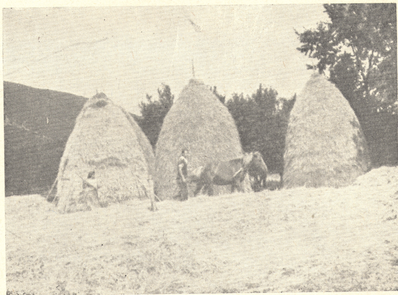
Sl. 7. Primitivna vršidba s konjima još uvijek je dominantna. Selo Konpolje, T. Korenica.

1. Travnjaci, poboljšani i ekstenzivni (nizinski i pretplaninski) — bijele žitarice (jare) — krumpir — gnojene prirodne livade — goveda (uzgojna) — ovce (poboljšani uzgoj) — konji (radni) — svinje (za tov) — perad. Tržni viškovi: krumpir, junad, telad, izlučena go-