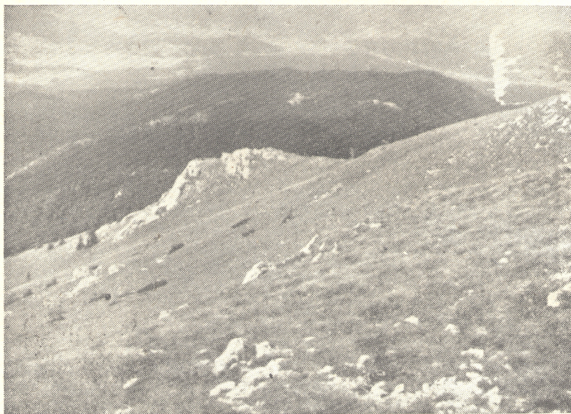
Sl. 1. Alpska vegetacija na Goloj Plješivici

1) Na teritoriju alpskih livada i rudina su bujni planinski pašnjaci i, rijeđe, livade. Na planinama nalazi se poseban pojas vegetacije, na kome su planinske rudine granica vegetacije. Na planinama ispod 2200 m drveće nema svoju klimatsku granicu, ali zbog vjetrova, sniježnih nanosa, stijena i točila, ona prestaje u stanovitoj udaljenosti ispod samog vrha (Gola Plješivica, na pr., vidi sl. br.: 1.), koji zapremaju planinske rudine. To se vidi i na razmjerno niskim vrhovima, ako su izloženi jakom vjetru. Zato je planinska vegetacija vrlo lijepo razvijena i na znatno nižim planinama (Plješivica, Velebit, Klek, Dinara i dr.).