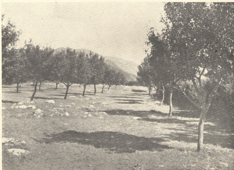
Sl. 4. Šljivik na kršu. Selo Konpolje, T. Korenica.

— bijele žitarice (ozime i jare) — prirodne livade — voće — povrće — goveda (uzgojna) — konji (radni) — svinje (za tov ili kombinirani uzgoj) — perad. Tržni viškovi: telad, izlučena goveda, odojci ili tovne svinje, janjci, izlučene ovce, perad i jaja. 7. Kukuruz — krumpir — bijele žitarice (ozime i jare) — crvena djetelina i prirodne livade i krmna repa — voće — povrće — goveda (uzgojna) — konji (radni) — svinje (za tov ili kombinirani uzgoj) — perad. Tržni viškovi: voće, telad, izlučena goveda, svinje tovne ili odojci, perad i jaja. 8. Bijele žitarice (ozime i jare) — crvena djetelina, lucerna, livade — krumpir — voće — kukuruz — povrće — goveda (proizvodna i rasplodna) — konji (radni) — svinje (rasplodne i tovne) — perad. Tržni viškovi: izlučena goveda, mlijeko, telad, bijele žitarice, krumpir i rakija.