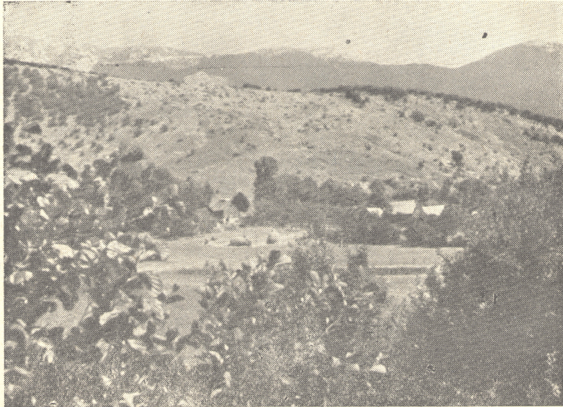
Sl. 3. Erozijska i degradacijska zemljišta na obroncima planina iznad naselja. Selo Mihaljevac, T. Korenica.

Ova zona zauzima relativno male površine. Iz aspekta poljoprivredne proizvodnje ima ona i u relativnom i u apsolutnom pogledu manji značaj, jer ima relativno malo površina podesnih za poljoprivrednu proizvodnju. Velik je, međutim, njen značaj, kao konzumenta poljoprivrednih proizvoda iz ostalih zona, a i sa stanovišta prometa poljoprivrednih proizvoda, osobito sa stanovišta izvoza tih proizvoda iz Like.