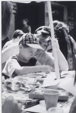
Fotografije su snimljene tijekom svibnja i lipnja 2000. u Zagrebu na Međunarodnoj konferenciji Balkanskih zemalja, edukaciji volontera te na Korak po korak igraonicama za djecu i roditelje na Cvjetnom trgu

Roditelji poučavaju djecu vezenju i šivanju u jednom azerbejdžanskom vrtiću. Roditelji u drugom vrtiću s djecom razgovaraju o njihovim zanimanjima i često donose predmete koji su vezani uz njihov rad. Baka iz Kirgistanu koja je umirovljena liječnica vodi radionicu o zdravom životu dva puta mjesečno. Ona također radi s hendikepiranom djecom, masira ih i radi na koordinaciji.