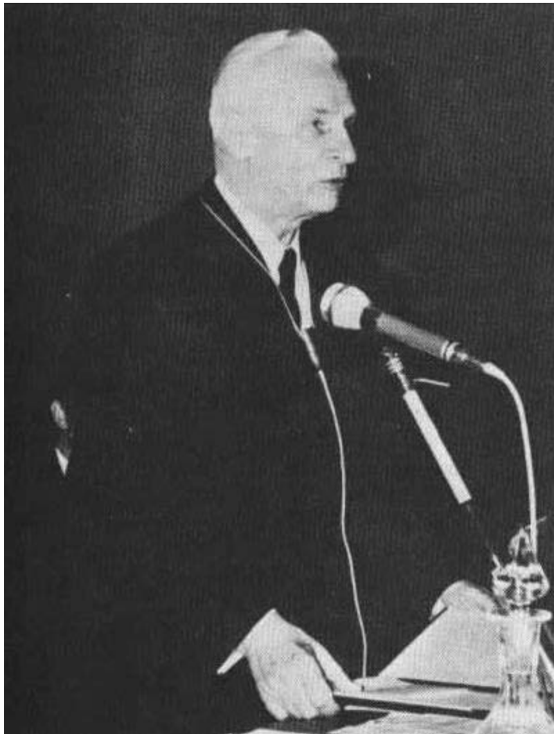
Red.prof.dr.sc. Božo Težak (1907 – 2017)

Sveučilište u Zagrebu, Hrvatska / University of Zagreb, Croatia