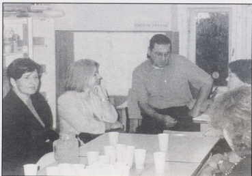
DV PIROVAC, Pirovac

To možemo objasniti i određenom specifičnošću situacije. Naime, roditelju djeteta s teškoćama