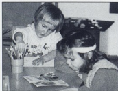
DV NJIVICE, Krk

"Društveno organizirani (institucionalni) predškolski odgoj na specifičan način pridonosi ostvarivanju općeg i jedinstvenog cilja odgoja u našem samoupravnom socijalističkom društvu, tj. formiranju slobodne i svestrane razvijene socijalističke ličnosti i osiguravanju, u skladu s pedagoškim i znanstvenim dostignućima, najmlađoj generaciji uvjete za optimalan tjelesni, intelektualni, emocionalni i socijalni razvoj i za uspješni odgoj i obrazovanje." ( Osnove programa... , 1983,3) U nastavku teksta slijedi tvrdnja kako "osobine zrele ličnosti imaju svoje ishodište u urođenim potencijalima pojedinca i na specifičan se način iskazuju svakom stupnju razvoja. Potičući i