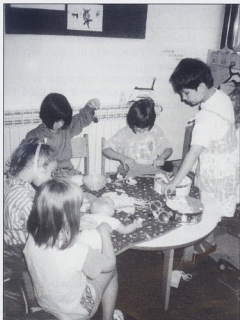
DV SAVICA, Zagreb

Ciljevi predškolskog odgoja u nabrojanim zakonskim uredbama u vremenu od 1945 do 1956. godine govore o centraliziranom modelu institucionalnog predškolskog odgoja o kojemu odlučuje državna i partijska administracija odnosno rukovodstvo. U njemu je najbitnija monolitnost, jedinstvenost na programskoj i praktičnoj razini. Središnja vrijednost u ciljevima društvenog predškolskog odgoja jest socijalna prikladnost kojoj odgovaraju svi oblici konformističnog ponašanja. Izvanjski autoriteti (institucije i pojedinci) su mjerilo ispravnosti mišljenja i postupanja. Sintagme kao "pravilan odgoj", "pravilan društveni odgoj i svestrani razvitak", "pravilan domaći odgoj, njegovanje i podizanje djece", "pravilan fizički razvoj i sl.", koje prevladavaju u navedenim zakonskim uredbama ilustriraju iskazane tvrdnje.