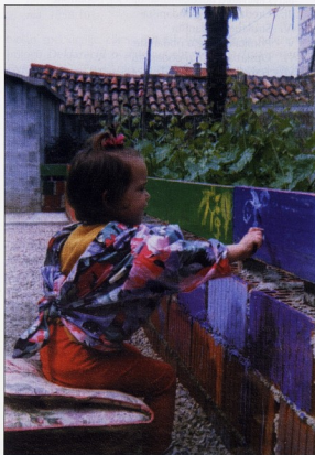
DV ORŠULA, Šibenik

iteta roditelja i djece te obitelji i institucije. Umjesto uzajamnosti pojavljuje se suparnički i potrošački odnos između obitelji i institucije. Predškolske institucije (dječje jaslice i vrtići), suglasno zvaničnoj ideologiji jednopartijskog sistema, imaju korekcijsku zadaću u odnosu na obiteljski odgoj u svrhu rješavanja "neadekvatnih odgojnih djelovanja". Roditelji kao korisnici usluga postaju predmet "pedagoške obrade" stručnjaka (od odgajatelja do različitih vrsta savjetnika u instituciji i širem okruženju).