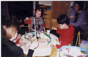
DV ZVONČIĆ, Zagreb

Veza prirode i djeteta je neprimjetna, čvrsta i stalna. Dijete i priroda su nerazdvojni, a da mi odrasli toga ponekad nismo svje-