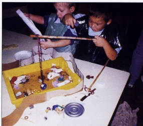
DV ZVONČIĆ, Zagreb

Jedna likovna tema je bila: Što nam priča glazba?, a uslijedila je nakon slušanja glazbe i razgovora. Djeci sam ponudila papire raznih veličina i oblika i zadatak je bio da papir najprije premažu bojom (jednim kistom i jednom bojom) te onda na tu podlogu štapićem nacrtaju svoje dojmove o glazbi. Radovi su bili jako zanimljivi i maštoviti.