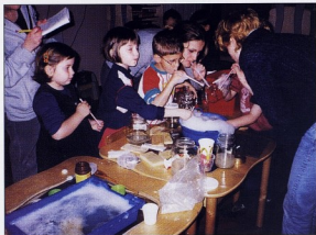
DV ZVONČIĆ, Zagreb

snj. Dijete uzima od prirode, a ona ga bogato daruje. Kamenčići, štapići, lišće, razni plodovi dostupni su djetetu uvijek, u svako doba i u svakom trenutku, bilo da se nalaze na ulici, u parku, na plaži, ljeti, zimi, jutro i navečer. Ta bogata riznica prirodnog materijala raznog oblika, istog, sličnog i različitog materijala, jestiva ili otrovna, dekorativna, traži da joj pokloni-