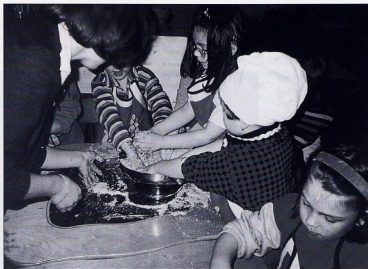
DV ZVONČIĆ, Zagreb

provlačim vrpce ili u tijesto umećem komadiće savinute žice na kojima predmet visi.