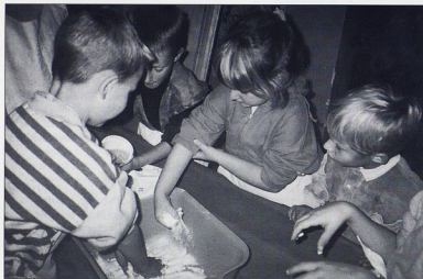
DV MRAV, Čakovec

Intenzivnijim radom s djecom u vrtiću i radom kod kuće pronašla sam odgovore na mnoga pitanja. U svom radu koristim jednaki omjer soli i brašna. Vodu dodajem onoliko koliko je potrebno da dobijem glatku smjesu. Nekon miješanja gotovo tijesto ostavljam da neko vrijeme odstoji jer mi se čini da je kasnije podatnije za modeliranje.