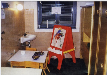
DV NJIVICE, Krk

U stvaranju dobrog okruženja treba krenuti od fizičkih potreba "jasličara". "Jasličari" trebaju, u pravilu, mjesta na kojima mogu jesti i spavati kad im to njihov tjelesni ritam naređuje. Oni počinju razvijati samostalnost, i zato okruženje treba biti uređeno tako da ohrabruje pravilne izbore i mogućnosti za svladavanje vještina samopomoći. Niske police s oznakama o onome što se na njima nalazi, stepenice ispod umivaonika, prozora i više opreme pomažu pri izgradnji neovisnosti. U pravilu bi većina dana u jaslicama morala proći u slobodnom izboru aktivnosti i u grupi i vani, a ne u djetetovom radu prema diktatu odgajatelja.