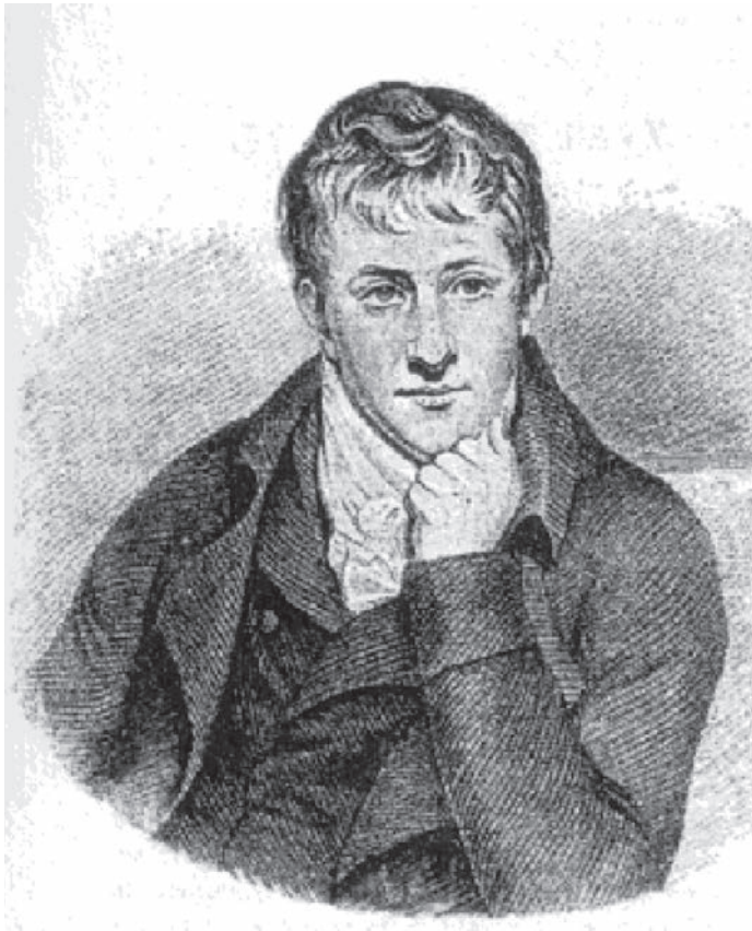
Sir Humphry Davy - istraživač vile Papyri

Herkulaneja, iskapanja su se obavljala pomoću kopanja tunela. Novi tunel izgrađen je te su ubrzo središnje prostorije i atrij vile otkopani i otvoreni za javnost, čime su otkrili dodatne dvije niže razine ispunjene zidnim slikarijama i geometrijskim mozaicima. Atrij je bio ukrašen u drugom stilu slikarstva dok su ostale prostorije sadržavale ukrase četvrtog stila slikarstva. (de Simone, 2010: 3)