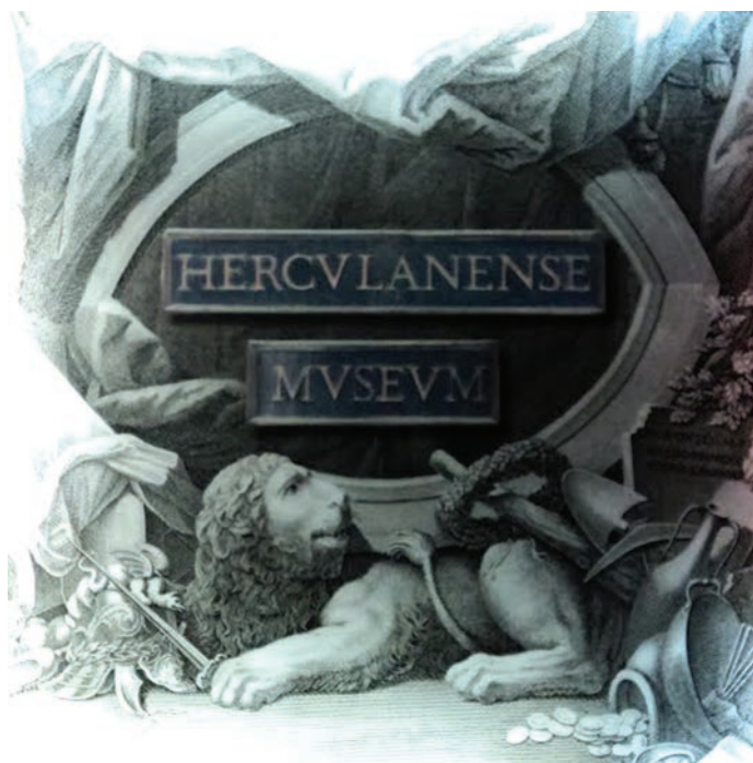
Ulazna slika u Museo Ercolanese

Zasluga za otkriće Herkulaneja ide austrijskom vojvodi d'Elbeufu (Emanuel Maurice de Lorraine) koji je oženio napuljsku princezu 1710. godine, te odlučio izgraditi vilu kraj morske obale i živjeti u mjestu Portici, mjestu veoma blizu Herkulaneju. Istovremeno, građanin iz obližnjeg grada Resine našao je nekoliko dijelova zakopanog mramora dok je kopao bunar na svom posjedu. Sve dijelove je odmah kupio vojvoda d'Elbeufa koji je pratio najnoviju modu u ukrašavanju aristokratskih vila svoga vremena te je bio zainteresiran mramornim komadima ukrasiti svoju vilu. Vojvoda je shvatio da su mramorni komadi, koje je kupio, antičkog porijekla, kupio je zemlju gdje su pronađeni i počeo je iskapanje. Prvo arheološko iskapanje u Kampaniji počelo je na d'Elbeufovu inicijativu. Njegovih je sedam radnika proširavajući kanale naišlo na zid zgrade kazališta u Herkulaneju, koja je bila jedna od najbolje ukrašenih zgrada u antici. Zgrada je greškom prepoznata kao Herkulov hram. Pozornica je otkrivena potpuno sačuvana zajedno s dijelovima sazdanim od mramora. Otkriveno kazalište pokazalo se kao mnogo veći izvor zarade, nego što je bilo očekivano. Nakon iscrpnog devetomjesečnog iskapanja d'Elbeuf je pozvan natrag u