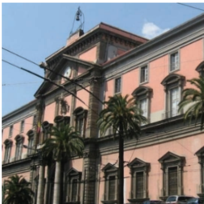
Zgrada Museo Ercolanese

Resina posjetiteljima, zato što tada ruševine nisu bile identificirane kao antički grad Herkulanej. Nakon odlaska vojvode d'Elbeufa, njegovu je vilu kupio vojvoda Giacinto Faletti di Cannaloga koji je nadopunio zbirku starina svojom nedokumentiranom zbirkom s nalazišta koje je on nadzirao. Vilu i kolekciju starina kupio je napuljski kralj, Karlo Burbonski, 1746. godine. Nekoliko manjih erupcija u periodu od 1717. do 1737. godine spriječilo je daljnja iskopavanja. (Lichtfield, 1981: 8)