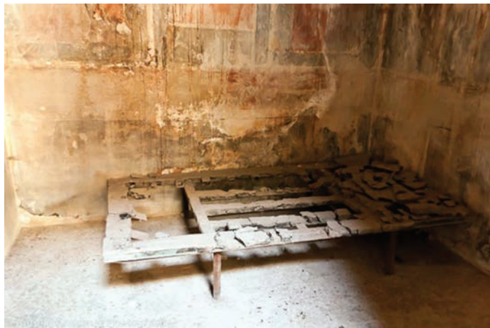
Sačuvani krevet u Termama Forum

predstavlja veoma važnu sliku tipičnog sustava prostorija u termama tijekom 1. stoljeća nove ere. Dobro očuvana prostorija s peći uključuje kružni bunar, rezervoare, stepenice (koje su služile za provjeru dva bojlera) i žarač, koji su bili sastavnim dijelovima sustava grijanja. (Fagan, 1999: 75)