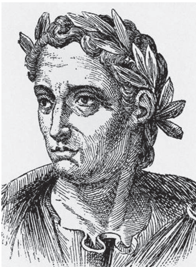
Plinije Mlađi - očevidac erupcije

od 17 godina zajedno sa svojim stricem. Njegova pisma bila su upućena rimskom povjesničaru Korneliju Tacitu kako bi odgovorio na njegovo pitanje kako je njegov stric Plinije Stariji umro u Napuljskom zaljevu tijekom erupcije. Izvještavajući Tacitu o sudbini svoga strica, Plinije Mlađi također je dao izvještaj o sudbini grada Pompeja. U vrijeme erupcije Plinije Stariji bio je poznati znanstvenik koji je tada služio kao rimski mornarički zapovjednik i njegova flota bila je smještena 32 km od Pompeja. Plinije Stariji napustio je svoj brod i požurio u luku Pompeji da bi iz blizine promotrio do tada nezabilježene prirodne katastrofe i kako bi detaljno opisao njezine karakteristike. (Ozgenel, 2008: 5)