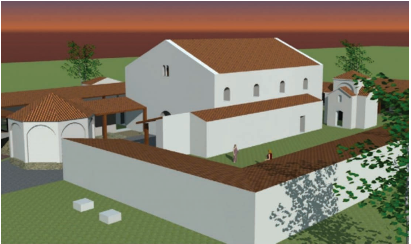
Digitalna rekonstrukcija bazilike na lokalitetu Kamenica, 4. st.

bogovima pa ga je Probus osudio na smrt. Spaljen je jednu rimsku milju daleko od grada 28. travnja 304. godine (Brunšmid, 1994: 20). Opis Polionove mučeničke smrti nalazimo u Mučeničkom spisu sv. Poliona čiji je originalni dokument kasnije prerađen (Rapan Papeša, 2011b: 211).