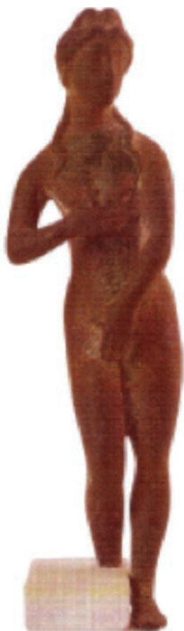
Brončana skulptura rimske božice Venere, 2 - 3. st.

kršćanstvo, te je postojala kršćanska općina koja je kasnije prerasla u biskupiju (Sanader, 2004: 29, 30).