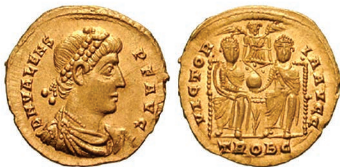
Novčić cara Valensa – na stražnjoj strani prikazan zajedno s bratom Valentinijanom I., 4. st.

Kao i neki drugi gradovi u ilirskim zemljama i Cibalae su rimskom carstvu dale vladare, a bili su to braća Valentinijan I. (364. – 375.) i njegov brat i suvladar Valens (364. – 378.). Otac tih rimskih careva Gracijan bio je rodom iz Cibala. O Gracijanu pripovijedalo se da je već kao dječak bio izvanredno jak. Bio je uspješan vojnik i pratio ga je glas jakog i spretnog čovjeka te je zato brzo načinio karijeru. Bio je tjelesni čuvar (protector), pukovnik (tribunus) i vojskovođa u pokrajini Africi. Nakon mnogo godina s istim činom upravljao je britanskom vojskom, a kada je odslužio i časno odstupio, vratio se kući u Cibalae gdje je spokojno živio (Brunšmid, 1994: 19).