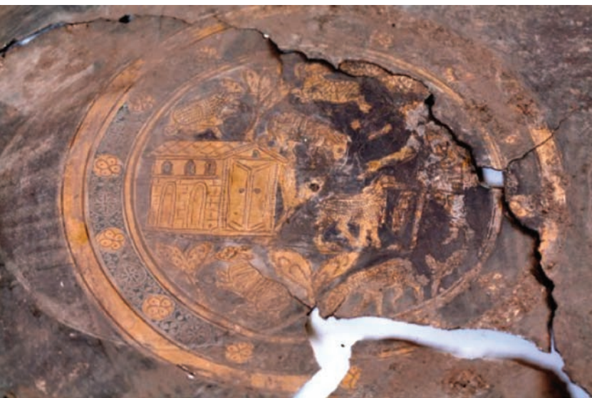
Primjerak srebrnog posuđa iz Vinkovaca, 4. st.

pločica sa zavjetnim reljefom (Brunšmid, 1994: 37).