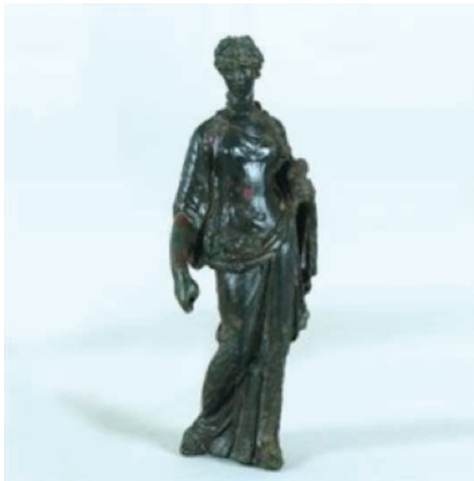
Brončana figurica Fortune – najljepši predmet iz Cibala, 1. st.

Jedno od najvažnijih otkrića iz Vinkovaca je ono iz 1897. godine kada je nađen zid dužine 1,8 i širine 1,5 m. Zid je najvjerojatnije služio kad temelj nekakvom