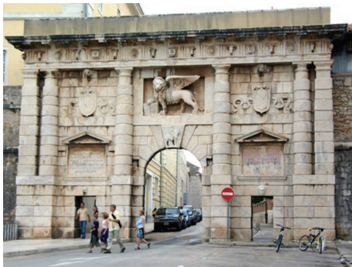
Kopnena vrata u Zadru

Kada su u svibnju godine 1797. Napoleonove trupe dokinule tisućljetno postojanje Mletačke Republike, Zadar i Dalmacija mirom su potpisanim u Campoformiju pripojeni Austriji. (Travirka, 2003: 12) No uskoro je Austrija, uslijed brojnih vojnih poraza, Napoleonu prepustila dio svojeg