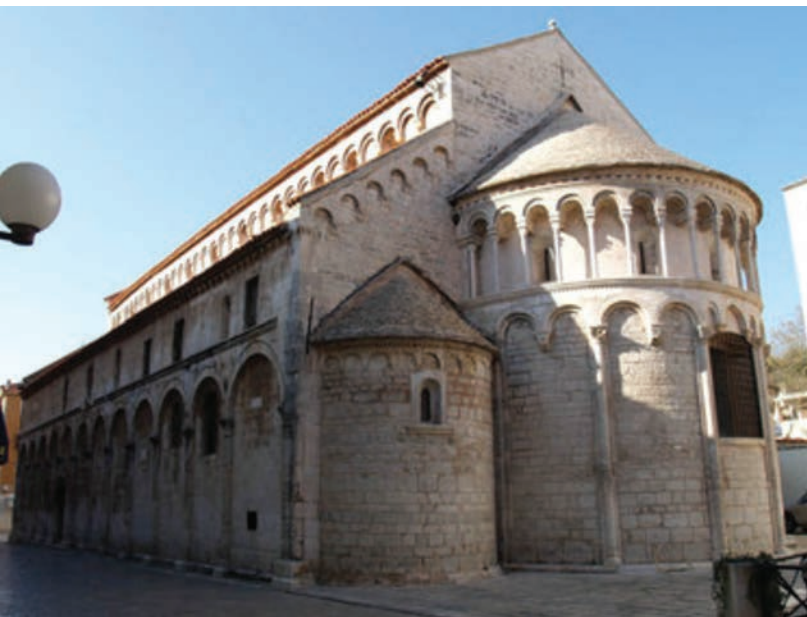
Crkva sv. Krševana