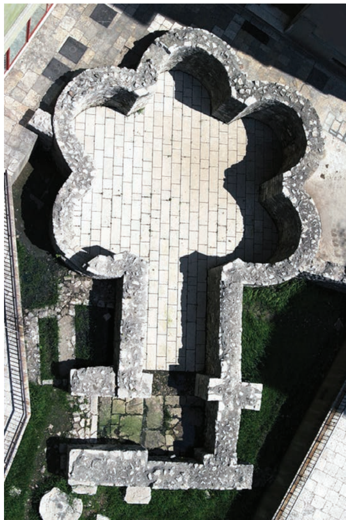
Stomorica, sačuvani temelji crkve

Zbog stalnog pritiska Osmanlija u 16. i 17. st., Zadranici su bili prisiljeni obnoviti već dotrajale zidine radi lakše obrane grada. U grad je došao najpoznatiji mletački arhitekt Michele Sanmicheli koji je od mletačke vlade dobio nalog da na kopnenoj strani grada sagradi nove gradske bedeme i obrambeni kanal. Na mjestu srednjovjekovnog gradskog ulaza (koji se nalazio na trasi antičkog ulaza) izgrađen je tzv. Ponton – monumentalni bastion za obranu grada. Godine 1829. barun Walden na tom mjestu dao je izgraditi prvi javni perivoj u Dalmaciji, danas poznat kao Perivoj kraljice Jelene Madijeveke, (Travirka, 2003: 12) a novi ulaz premješten je jugozapadno od Pontona (tzv. Kopnena vrata). Godine 1543. po nacrtima Michelea Sanmichelia izgrađena su Kopnena vrata ( porta terraferma ) u formi slavoluka (slično kao i antički ulaz u grad). Sanmicheli