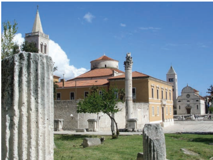
Ostaci rimskog foruma

u mnogim gradskim četvrtima i u blizini foruma. Zasad su najbolje istražene te velike gradske terme. Najveća antička građevina – amfiteatar nalazio se izvan gradskih zidina. Ostaci amfiteatra bili su uočljivi još u 17. st. kada je nad njima sagrađena mletačka tvrđava (Mezzaluna) izvan prostora poluotoka. (Jeličić Radonić, 2014: 101)