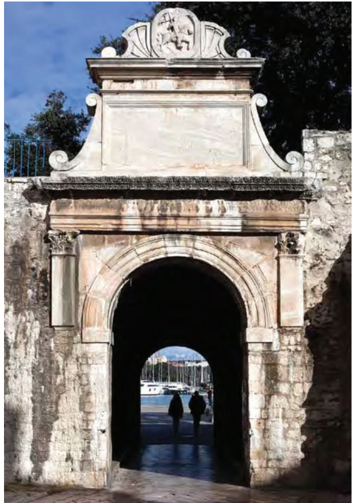
Slavoluk Melije Anijane

U vrijeme romanike (1000.–1250.) Zadar se može pohvaliti jednom od najljepših romaničkih crkava u Hrvatskoj – crkvom sv. Krševana. Riječ je o samostanskoj trobrodnoj bazilici muških benediktinaca posvećenoj 1175. godine. Tu je zapravo bila ranija crkva sv. Krševana iz 10. stoljeća koja je preuređena i proširena. Nažalost od samostana – koji se nalazio na mjestu današnjeg Narodnog