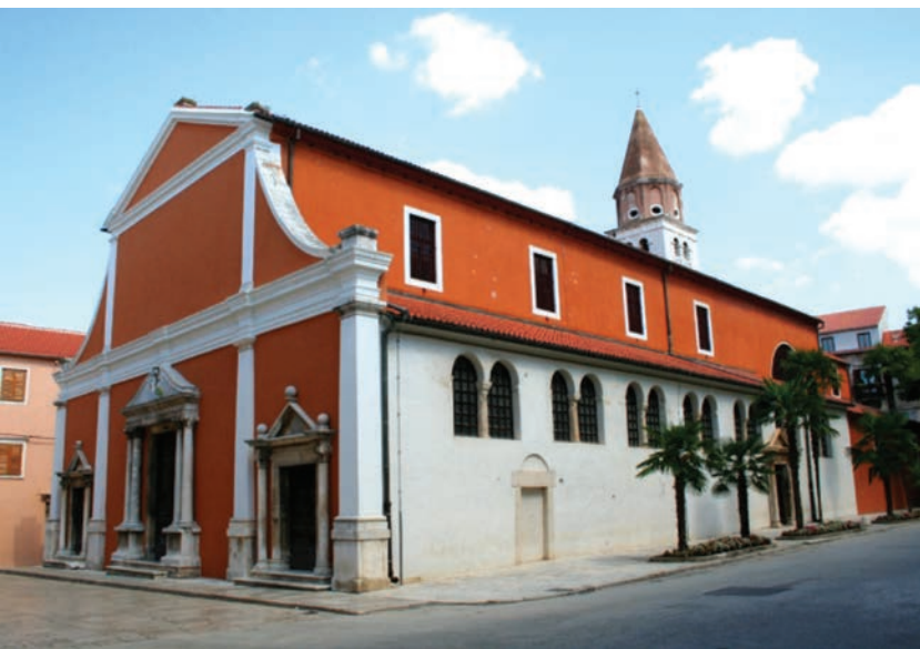
Crkva sv. Šime

najpoznatiji i najcjenjeniji bio je Maraschino - danas izvorni zadarski suvenir. (Travirka, 2003: 14)