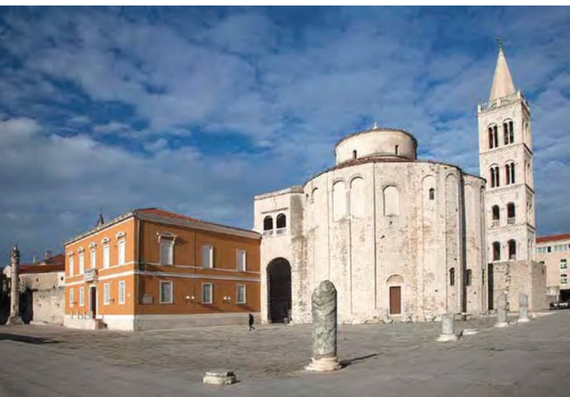
Forum i crkva sv. Donata

Razdoblje od 3. do 5. st. obilježeno je prodorima brojnih naroda kroz granice Rimskog Carstva. U tom razdoblju razvija se u gradu nova religija – kršćanstvo, koja će svoje temelje imati na području foruma. To je zapravo rijedak slučaj da se na glavnom poganskom forumu formira nova religija. Ali upravo tu kršćani će podignuti svoj prvi oratorij, krstionicu, biskupsku palaču, a kasnije i