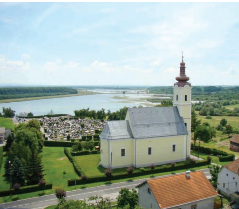
Župa Pohoda Blažene Djevice Marije u Garešnici