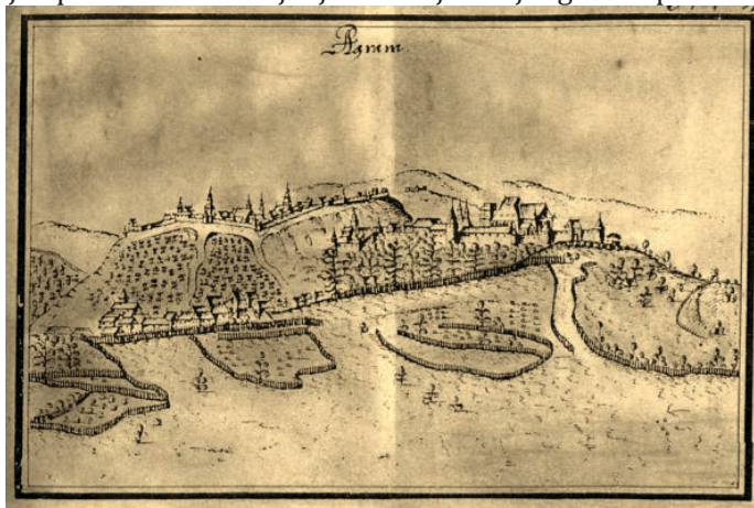
Nacrt grada Zagreba u prvoj polovici XVII. stoljeća. Oko 1639. Original u zbirci Raimunda Montecuccolija u ratnom arhivu u Beču.

Izgled Gradeca s početka i s kraja 17. stoljeća gotovo je neusporediv. Dok mu je izgled na početku navedenog razdoblja skoro u potpunosti bio srednjovjekovan, još uvijek potpuno okružen i zatvoren zidinama i kulama, na kraju 17. stoljeća vidljiva je njegova postupna preobrazba u barokni grad. Kako se bližio kraj 17. stoljeća, osmanska je opasnost sve više jenjavala te je dvojni grad usporedno