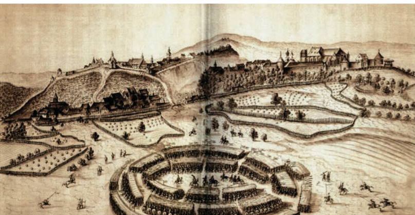
Slika 2. Veduta Zagreba iz 1631.

Jelačića, Oršića, Zrinskog, kao i zidane zgrade samostana klarisa, isusovaca i dominikanaca (Buntak, 1996: 382–383). Na mjestu dotadašnjih gradskih zidina počeo se također javljati niz palača koje su potpuno izmijenile vanjsku sliku grada. Dakle, skromne srednjovjekovne, većinom drvene kuće i gospodarske zgrade u uskim ulicama i dvorištima su postupno pretvarane u reprezentativnije oblike baroknog grada sa širim ulicama te pojedinim istaknutijim zgradama i trgovima.