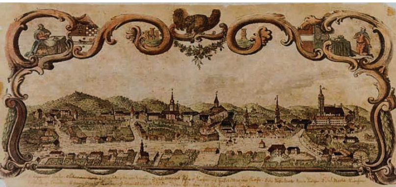
Pogled na Zagreb, gornji dio majstorskog lista, kraj 18. st., (MGZ)

srednjovjekovne građanske kuće“ (Buntak, 1996: 595).