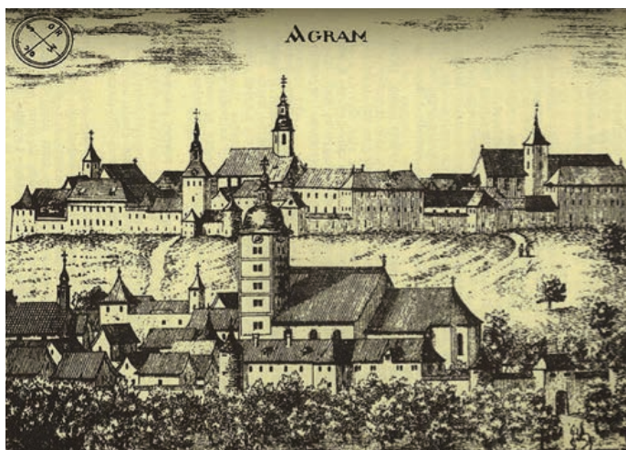
Zagrebački Gradec i Kaptol oko 1689., grafika iz Valvasorova djela Die Ehre des Herzogthums Krain .

Prvi veliki požar u 17. stoljeću izbio je 1624. godine. Naime, te je godine vladala velika suša, ali je uslijed jedne pokorničke procesije kojom se molilo za kišu, došlo do nevremena. Grom je udario u krov katedrale, nakon čega se razbuktao veliki požar zahvativši cijelu katedralu, susjedni biskupski dvor te čitav Kaptol (Povijest grada Zagreba, 2012: 184). Još jedan od većih požara, kojeg je izazvala neopreznost pijanog učenika na Markovu trgu, izbio je u ožujku 1645. godine. Zbog vjetrova se vatra vrlo brzo proširila na drveni krov crkve sv. Marka, a ubrzo je zahvatila čitav Gradec. Sve drvene kuće su izgorjele, kao i cijeli isusovački kompleks (gimnazija, samostan, sjemenište sv. Josipa i crkva sv. Katarine). Požar se proširio preko potoka Medveščak na obližnji Kaptol te je i tamo prouzročio golemu štetu. Izgorjele su sve kanoničke kurije,