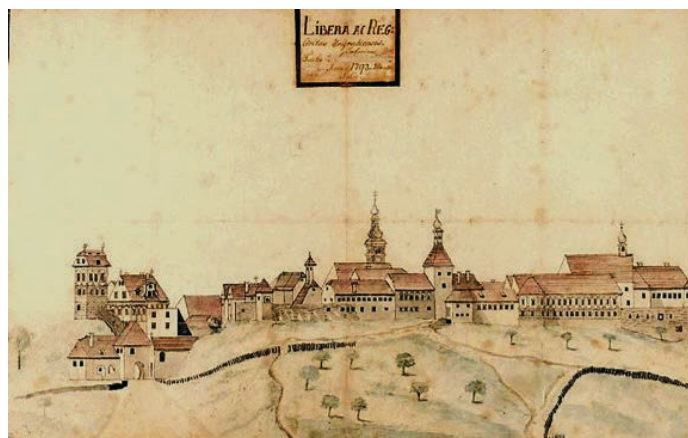
Ludovik Bužan, Slobodni i kraljevski grad na brdu Grečkom, 1792., (MGZ)

Izgled Sajamskog trga, koji se od 18. stoljeća najčešće zvao Harmicom, 8 također se izmijenio. Na zapadnoj, sjevernoj i istočnoj strani stajale su kao i u 17. stoljeću stambene zgrade, ali sada uglavnom zidane (Buntak, 1996: 596). Naravno, bilo je još i praznih zemljišta, ali puno manje nego u prethodnom stoljeću. Današnje Jurišićeve na istočnoj strani još nije bilo, ali se prema jugu pružala Petrinjska ulica. Općenito je južna strana Harmice u 18. stoljeću i dalje bila vrlo slabo izgrađena. Krajem stoljeća, godine 1794., počela se na jugozapadnoj strani graditi velika Zakladna bolnica milosrdne braće (Buntak, 1996: 596) na čijem je mjestu dotada bilo prazno zemljište s majurom i manjim gospodarskim zgradama. 9 Zapadna, sjeverna i istočna strana Harmice, kao i Duga ulica, dale su u 18. stoljeću današnjem centru grada urbani karakter.