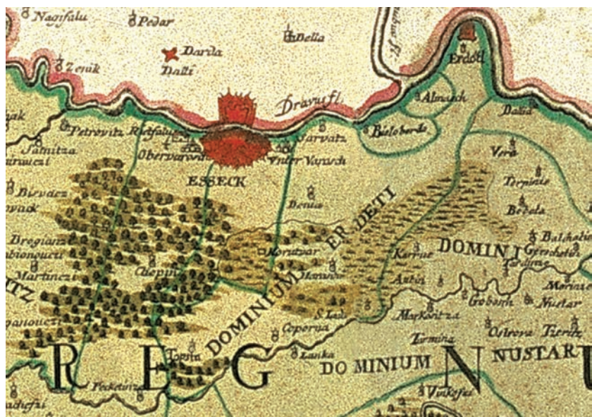
Regnum Slavoniae (Atlas Vukovarskog vlastelinstva 1733., priredio Ante Grubišić, Osijek 2006.)

Čepin je do 1751. godine bio pod vojnom upravom. To je izuzetak u Slavoniji, no to su tražili vojni interesi, prvenstveno gradnja i održavanje osječke tvrđave.