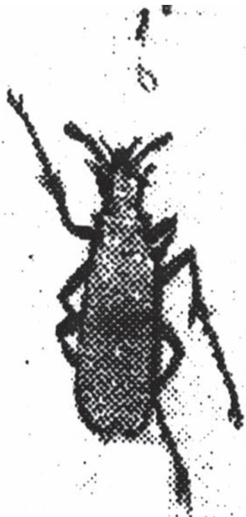
Adamovichev majak (Matija Piller i Ljudevit Mitterpacher, Putovanje po Požeškoj županiji u Slavoniji 1782. godine, preveo i priredio Stjepan Sršan, Osijek 1995., 181.)

U sklopu kanonskih vizitacija, drugi popis Čepina obavljen je 1784. godine po naredbi Visokog kraljevskog namjesničkog vijeća i skupštine Virovitičke županije iz 1783. godine. Popis je iznesen pred županijskom skupštinom u Osijeku 1784. godine. Patronatsko pravo vrši zemljišni gospodar Ivan Kapistran Adamovich de Csepin. Mjesto ima 139 katoličkih duša od kojih je 100 sposobno za ispovijed. Crkva može primiti 500 duša, obilno je opskrbljena crkvenim namještajem i drugim potrepnostima. Zbog malog broja vjernika ne postoji potreba za mjesnim kapelanom, nego mjesto treba kao filijalu pripojiti matičnoj brođanačkoj crkvi. Godišnji