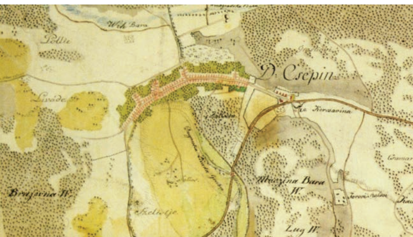
Selo Čepin (Virovitička županija priredile Ivana Horbec i Ivana Jukić, Zagreb 2002.)

Zemaljska cesta koja vodi iz Čepina u Vuku ima glibljivo tlo koje se za vlažnog vremena razmoči te otežava prijelaz. Voda se nakuplja u rupama na cesti i tijekom ljetnih mjeseci te kola slabo napreduju. Put koji vodi u Martince ima dobro pjeskovito tlo i dovoljno široke kolotečine za teška kola te je samo u udubljenjima ponešto mek. Put za Dopsin dobre je kakvoće i širine. Zemaljskom cestom ide preko bare Palača, preko 1000 koraka dugog i devet koraka širokog mosta. Put nakon odvajanja od zemaljske ceste ima meko i glibljivo tlo, jako je uništen i uzak. Kolotečine su