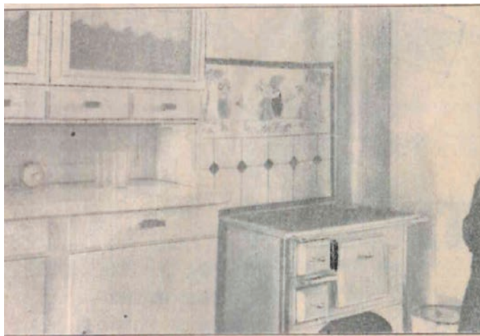
Kuhinja u kući Batinog naselja

se pokrivala za krevet trebala slagati s uzorkom zavjesa. („Borovo”, br. 36, 1933: 3)