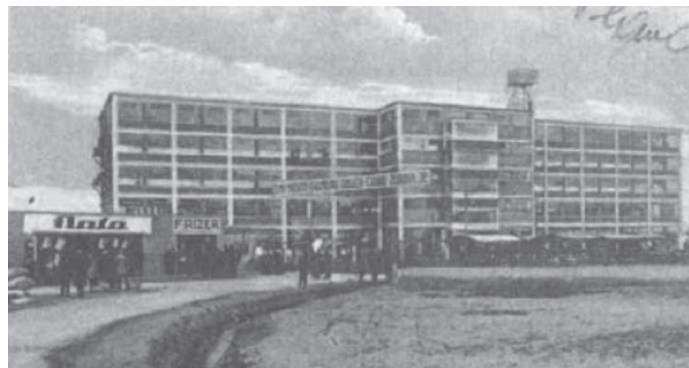
Zgrada obučare. Prva proizvodna hala izgrađena nakon 1932.

Borovski je „Bata“ replika i tvornice i naselja u Zlinu, a vuče svoj korijen iz nekoliko prizemnih prostorija u vukovarskom pristaništu, u tzv. češkoj agenciji, gdje su 1931. počeli stizati prvi strojevi i stručnjaci. Te godine „Bata“ je u Jugoslaviji imao 88 prodavaonica, iako je ostvarena proizvodnja bila neznatna i sve je bilo usmjereno obučavanju radnika Kombinata. (Duić, 2005: 39) Za izgradnju tvorničkog kompleksa izabrana je velika slobodna površina koja je omeđena Dunavom i željezničkim krakom. Tvornice