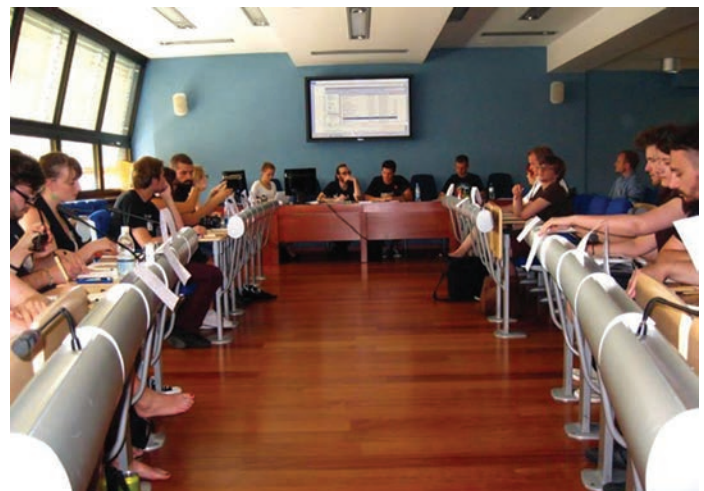
State of Affairs - Sastanak svih ISHA sekcija

Već prvoga dana dolaska u Ljubljanu u hostelu su nas dočekali stari poznanici, članovi ISHA-e Ljubljana, a istog je dana održan i tradicionalni Ice-Breaking Party