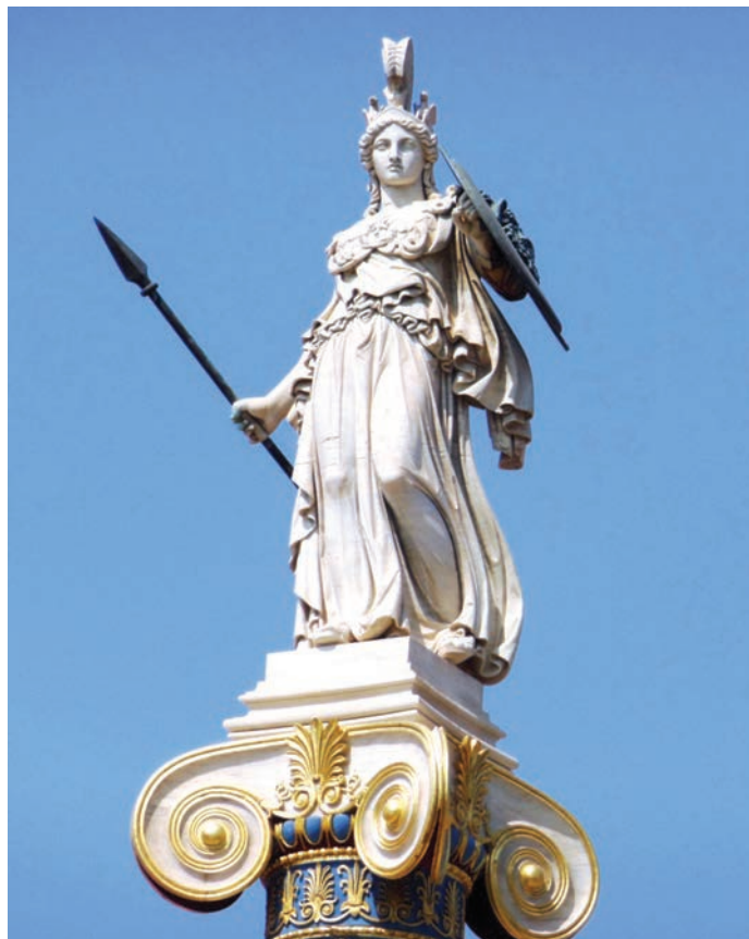
Kip božice Atene

Preostali su još matagejtnon (kolovoz) i majimakterion (studeni), u kojima je zasigurno bilo vjerskih ceremonija, no u dokumentima ima vrlo malo spomena o blagdanima u tim mjesecima, tj. o Metagejtnijama i Majimakterijama . Iz navedenog možemo vidjeti da se u Ateni svetkovalo kroz cijelu godinu (Flaceliere, 1979: 218).