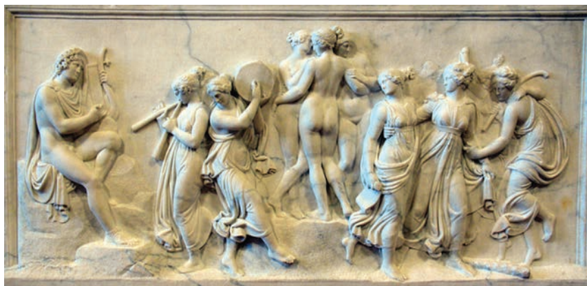
Ples muza na Helikonu

Naše poznavanje drevnih grčkih mitova oslanja se na djela pisaca koji su živjeli u IX. i VIII. st. pr. Kr. Uz to je potrebno prihvatiti i činjenicu o nemogućnosti utvrđivanja identiteta prvih pripovjedača tih priča ili njihovih promjena tijekom stoljeća do trenutka kad su bile zapisane. Do određenih spoznaja možemo doći i kroz djela gravera, kipara i slikara, ali ih ipak moramo povezati sa zapisanim pričama kako bismo ih mogli s djelomičnom sigurnošću poistovjetiti s njima (Barnett, 2000: 142).