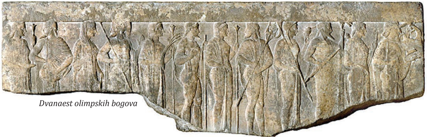
Dvanaest olimpskih bogova

a brojni ljudi odabrali su uvođenje u neki tajni kult. Svaki grad imao je vlastiti kalendar svetkovina, a vjerojatno su i manje zajednice imale svoje religijske programe (Stafford, 2004: 115).